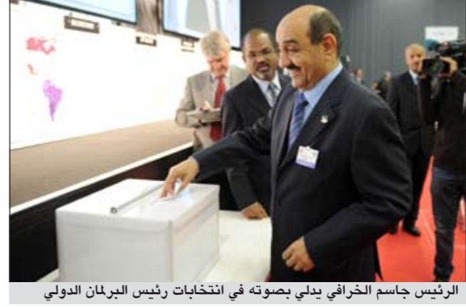
الرئيس جاسم الخرافي يدي بصوته في انتخابات رئيس البرلمان الدولي

أعرب رئيس مجلس الأمة جاسم الخرافي عن سعادته باختيار رئيس البرلمان المغربي عبدالواحد الراضي لرئاسة الاتحاد البرلماني الدولي في المرحلة المقبلة. وقال الخرافي في تصريح لـ «كونا» ان الكويت قد دعمت المرشح المغربي وحصلت لذلك على إجماع من المجموعتين العربية والإسلامية في الاتحاد، متمنيا له التوفيق والنجاح في مهمته مغربا عن ثقته بأن يقود الراضي الاتحاد البرلماني الدولي بشكل مشرف. من ناحية قال النائب مرزوق الغانم لـ «كونا» ان الراضي «يحمل برئاسته للاتحاد البرلماني الدولي مضمنا مهمما للغة العربية وبالتالي يمثل المجموعة العربية لاسيما أنه شخصية برلمانية مرموقة وله تاريخ برلماني طويل وعريق وتعرفت عليه عن قريب أثناء عضويته للجنة التنفيذية للاتحاد البرلماني الدولي». وأعرب الغانم عن تفاؤله بأن «المجموعة العربية ستترك بصمة واضحة داخل الاتحاد البرلماني الدولي في هذه المرحلة الدقيقة من المنطقة التي تصادف أن يترأس الاتحاد شخصية برلمانية عربية محنكة مثل الراضي». كما أعرب الراضي خلال أول حديث لوسيلة إعلام عربية خص به «كونا» عن شكره لشعب الكويت وكل الدول العربية على الثقة التي وضعتها في شخصه بالترشح باسم المجموعة العربية.