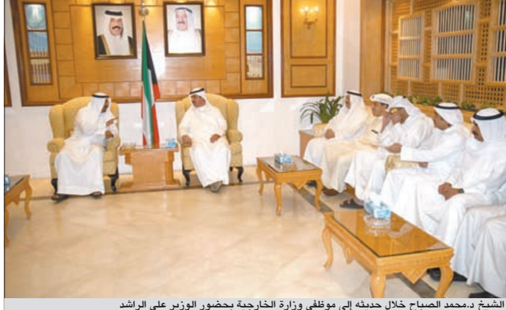
الشيخ د.محمد الصباح خلال حديثه إلى موظفي وزارة الخارجية بحضور الوزير علي الراشد

ستوجه الشيخ د.محمد الصباح إلى لندن لقضاء اجازة خاصة، وذلك بعد قبول استقالته التي تقدم بها وفي أجواء أخوية حميمة ودع الشيخ د.محمد الصباح وبحضور وزير الدولة لشؤون مجلس الوزراء ووزير الخارجية بالوكالة علي الراشد وكيل وزارة الخارجية ومدراء وكبار مسؤولي وزارة الخارجية، وقد عبر الشيخ د.محمد الصباح في بداية اللقاء عن عظيم مشاعر التقدير والامتنان الى صاحب السمو الأمير الشيخ صباح الأحمد على ما أحاطه سموه به طيلة فترة توليه حقيبة الخارجية من رعاية واهتمام وتوجيهات أنوية سديدة كان لها الأثر الطيب في المضي بمسيرة الدبلوماسية الهادفة الى الدفاع عن مصالح الكويت ومشاغها معتبرا ان التوفيق والنجاح اللذين حققتهما وزارة الخارجية طيلة مسيرتها كانا بفضل الله سبحانه وتعالى ثم بفضل البنيان الراسخ الذي أرسى قواعده صاحب السمو الأمير رعاه الله. وأضاف مخاطبا الحضور «انكم محظوظون كونكم نتاج مدرسة اسمها صباح الأحمد تلك المدرسة العريقة دبلوماسية وقيما».