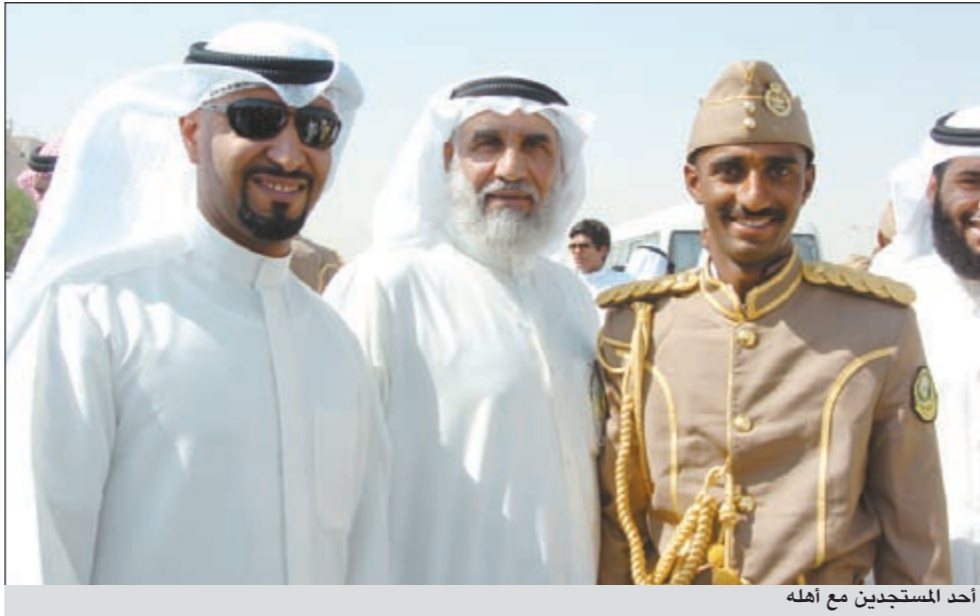
أحد المستجدين مع أهله

متواصل وجدية في التعايش والتعامل وتغيير جذري في برنامج ونمط الحياة اليومية وتحديا أمام الراغبين في الاستمرار في السلك العسكري واتخاذ خيارا ومهنة واسلوب حياة ما يتعكس ايجابا على حياتهم مستقبلا. واوضحت ان المرحلة شملت التدريب على الجوانب الفكرية متمثلة بالدراسات والمحاضرات النظرية الى جانب التدريب البدني المتكامل في اللياقة والتمارين والتدريبات العملية الداخلية والخارجية الى جانب التأهيل والتدريب النفسي لتطوير قدرات الجدل والصبر وقوة التحمل في مختلف الظروف ما يساعد على ترسيخ الاعتزاز والثقة بالنفس وبناء الشخصية العسكرية القيادية.