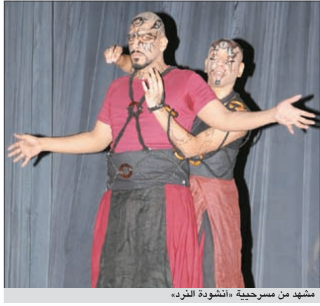
مشهد من مسرحية «أنشودة النرد»