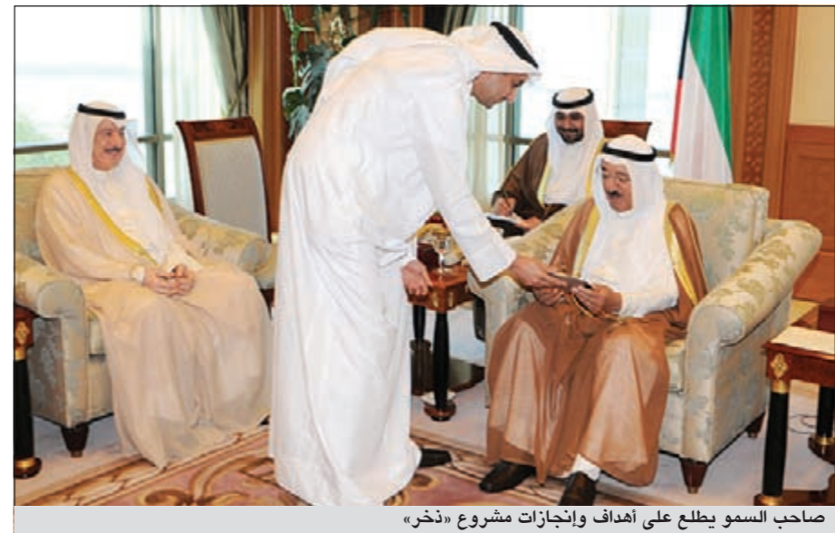
صاحب السمو يطلع على أهداف وإنجازات مشروع «ذخر»

استقبل صاحب السمو الأمير الشيخ صباح الأحمد بقصر السيف صباح أمس وزير الدولة لشؤون التخطيط والتنمية عبدالوهاب راشد الهارون حيث قدم لسموه أعضاء مشروع «ذخر»، المشروع الوطني لتطوير قيادات التنمية كلا من رئيس التحرير الزميل يوسف خالد المرزوق وجاسم الصفران وميسم الدعيج ونور بورسلي وعمر العمر وفراس العودة. وقد أشاد سموه بجهود القائمين على المشروع والذي يساهم في بناء الوطن من خلال تحفيز القيادة والإبداع بما يدفع مسيرة التنمية والنماء بالوطن العزيز متمنياً سموه حفظه الله لهم دوام التوفيق والنجاح. وحضر المقابلة نائب وزير شؤون الديوان الأميري الشيخ علي الجراح.