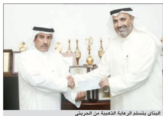
البناي يتسلم الرعاية الذهبية من الحريتي

الحريتي السكرتير التنفيذي لنائب العضو المنتدب في الشركة الكويتية لنفط الخليج على أهمية الحوار المشترك على أهمية المشترك من أجل دعم المشاريع والقضايا الاجتماعية، لأن دور شركات النفط والطاقة وغيرها من الشركات الكبرى لا يقتصر على العمل في مجال استخراج البترول وتصنيعه وتسويقه بل هذا يشمل دعم المشاريع الاجتماعية والتربوية لأن بناء الإنسان يظل هدفا محوريا وأساسيا لتلك الشركات والمؤسسات الوطنية والخليجية الكبرى، وأكد الحريتي أن عمليات الخفجي المشتركة - الشركة الكويتية لنفط الخليج - كانت على مدى السنوات الماضية دائما بمثابة