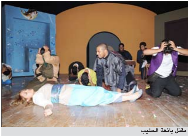
مقتل بائعة الحليب

ويبدأ تجار السوق في البيع واحدا تلو الآخر إلا أن بائعة الحليب ترفض البيع وتقوم بعمليات تحريضية لأهالي البلدة لعدم الاستسلام