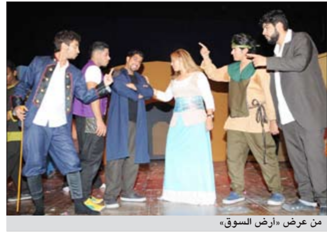
من عرض «أرض السوق»

يتعمق بها في رؤيته الإخراجية التي جاءت مليئة بالإخطاء رغم أن النص يعطيه المجال