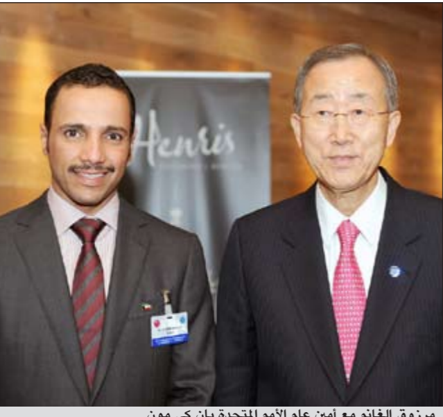
مرزوق الغانم مع أمين عام الأمم المتحدة بان كي مون