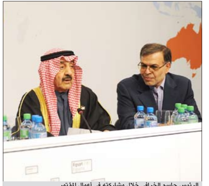
الرئيس جاسم الخرافي خلال مشاركته في أعمال المؤتمر

قادر رئيس مجلس الأمة رئيس الشعبة البرلمانية الكويتية إلى اجتماع الجمعية العمومية الـ 125 للاتحاد البرلماني الدولي جاسم الخرافي الاتحادين العربي والإسلامي في دعم المرشح المغربي عبدالواحد الراضي لرئاسة الاتحاد البرلماني الدولي كعضو للمجموعة العربية في مقابل المرشحة الإندونيسية دنور حياتي. وأشاد الخرافي بالتنسيق الذي قام به ممثل المجموعة العربية في الاتحاد الدولي ونائب رئيس الاتحاد الدولي العضو مرزوق الغانم إذ شرح الدور الذي قامت به اللجنة التنفيذية بالاتحاد بصفتها عضواً فيها. وأضاف الخرافي في تصريح صحفي أن الاجتماعين العربي والإسلامي اللذين عقداً أول من أمس ناقشا موضوع اختيار بند طارئ ليتم اعتماده ووضع على جدول أعمال المؤتمر «هو الموضوع الذي كان في حاجة لتنسيقه»، مضيفاً أن هناك مقترحين تم تقديمهما في هذا الشأن أولهما الذي قدمته جمهورية نايبيا ويتعلق بدعم جهود الإغاثة في الصومال جراء ما تعرضت له أخيراً. وأوضح الخرافي أن المقترح الثاني تقدمت به فلسطين ويخص بان يقوم الاتحاد البرلماني الدولي بالطلب من البرلمانات الأعضاء فيه دعوة حكوماتها إلى دعم المسعى الفلسطيني في مجلس الأمن من أجل نيل العضوية الكاملة لدولة فلسطين في الأمم المتحدة. وأكد الخرافي أن المجموعتين