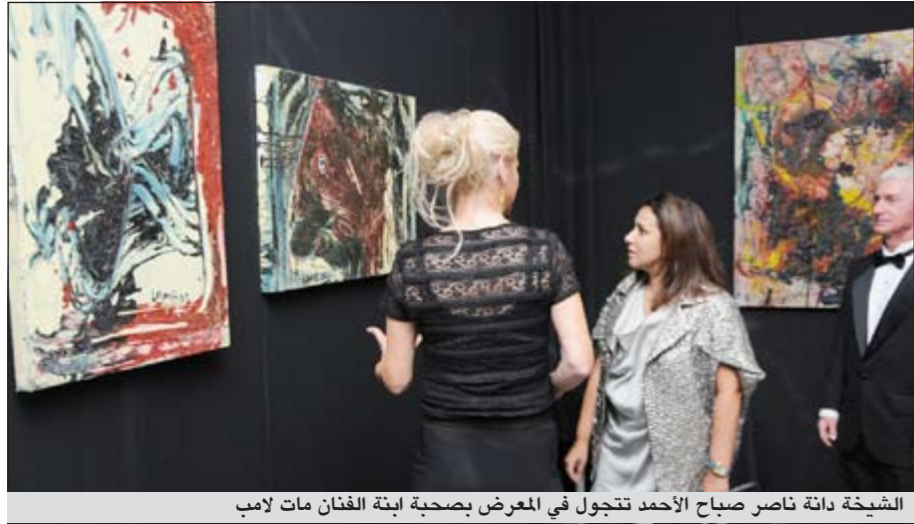
الشيخة داتة ناصر صباح الأحمد تتجول في المعرض بصحبة ابنة الفنان مات لامب