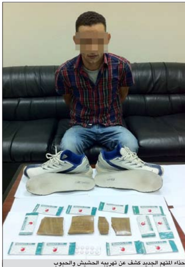
حذاء المتهم الجديد كشف عن تهريبه الحشيش والحبوب

تقدم مدير قانوني لبنك محلي ببلاغ إلى أحد مخافر محافظة العاصمة منتهماً مدير إدارة في وزارة الاعلام وموظفة بنهمة التزوير في محررات رسمية وسجلت القضية تحت رقم 2011/697.