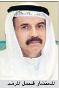
المستشار فيصل المرشد

قررت المحكمة الدستورية أمس برئاسة المستشار فيصل المرشد تأجيل النطق بالحكم في طلب تفسير بعض مواد الدستور الخاصة بالاستجواب وأعمال رئيس مجلس الوزراء المقدم على خلفية الاستجواب المقدم من النائبين أحمد السعدون وعبدالرحمن العنجري لجلسة 20 الجاري.