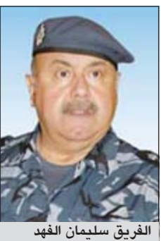
الفريق سليمان الفهد

يغادر البلاد صباح اليوم وكيل وزارة الداخلية بالإنيابة الفريق سليمان الفهد على رأس وفد الكويت متجهاً إلى أبوظبي بالإمارات العربية المتحدة للمشاركة في اجتماع وكلاء وزارات الداخلية بمجلس التعاون لدول الخليج العربية، وذلك للتحضير للاجتماع الثلاثين لأصحاب السمو والمعالي ووزراء