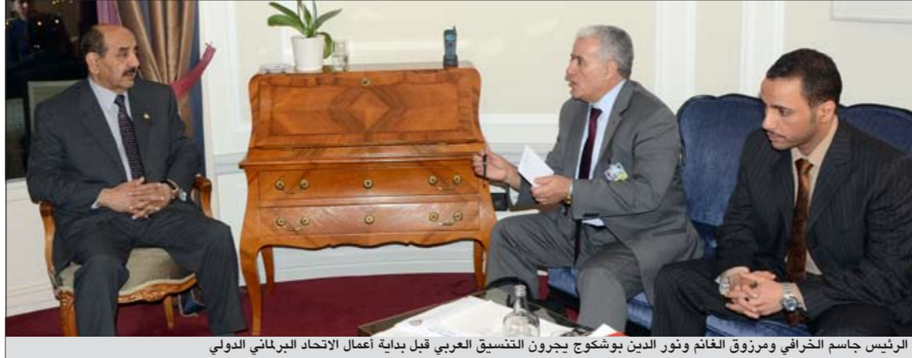
الرئيس جاسم الخرافي ومرزوق الغانم ونور الدين بوشكوج يجرون التنسيق العربي قبل بداية أعمال الاتحاد البرلماني الدولي