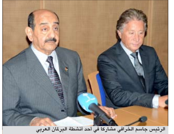
الرئيس جاسم الخرافي مشاركاً في أحد أنشطة البرلمان العربي