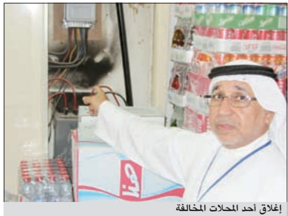
إغلاق أحد المحلات المخالفة

ووصلت بلدية الكويت من خلال فروعها بالمحافظات تنفيذ حملاتها التفتيشية المفاجئة، التي تقوم بها على مدار الساعة لتطول جميع مجالات العمل الرقابي، خاصة ما يتعلق منها بالمواد الغذائية للتأكد من مدى صلاحيتها للاستهلاك الآدمي ومطابقتها لجميع الاشتراطات الصحية، تنفيذاً للتعليمات المباشرة من وزير الأشغال العامة ووزير الدولة لشؤون البلدية د. فاضل صفر ومتابعة مدير عام البلدية م. أحمد الصبيح التي تهدف إلى قطع الطريق أمام المتجاوزين للوائح وأنظمة البلدية، حرصاً على صحة وسلامة المستهلكين واتخاذ كافة الإجراءات القانونية ضد المخالفين، ممثلاً من خلالها جهود مفتشي البلدية بجميع المواقع والذين يواصلون العمل ليلاً ونهاراً حتى يتم وضع الأمور في نصابها الصحيح.