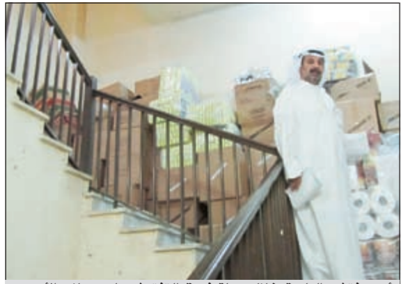
أحد مفتشي البلدية خلال جولة فريق التفتيش على محلات الأحمدية