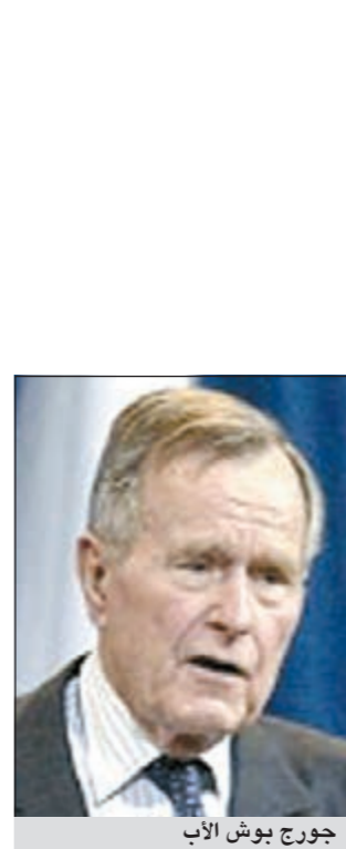
جورج بوش الأب

استبعدت بسرعة... ولا شك أن المعجبين بالممثل والمخرج الأميركي كانوا يحذون أن يطبع البيت الأبيض بطابعه الخاص. إلا أن جورج بوش الأب اختار في نهاية المطاف عضو مجلس الشيوخ الشاب دان كويل في هذا المنصب وفاز في الانتخابات الرئاسية.