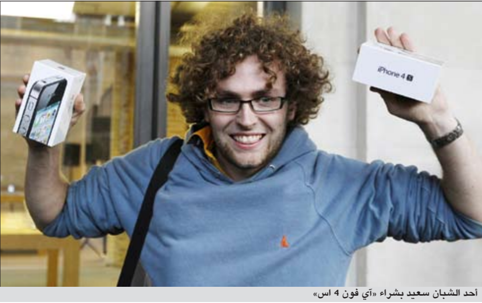
أحد الشبان سعيد بشراء «آي فون 4 اس»

ودفع الحماس الكبير الذي استقبل به العملاء الجهاز الجديد سواء في متاجر «أبل» أو في منافذ شركات الاتصالات الهاتفية التي تمتلك حق بيع الجهاز المحليين إلى توقع تسجيل رقم قياسي جديد بالنسبة لمبيعات أي جهاز هاتف ذكي جديد. وفي حين يتوقع أغلب المحللين أن تتراوح المبيعات بين مليوني و3 ملايين جهاز خلال اليومين المقبلين فإن كارل هوي المحلل في مؤسسة بانكي جروب يتوقع وصول المبيعات إلى 4 ملايين جهاز خلال يومين. من جهة أخرى، قال الأسترالي توم موسكا أنه قد يكون أول شخص في العالم يشتري الهاتف «آي فون 4 اس» بعد أن