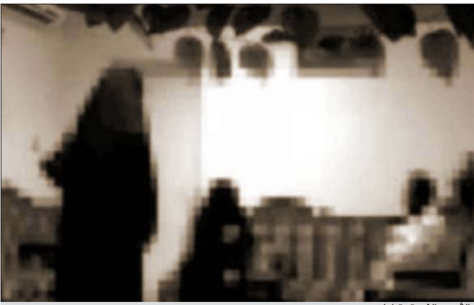
الفيديو الذي تم تداوله