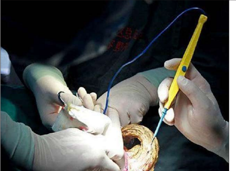
البريطانية أثناء العملية

بكتابة «لوغاريتم» يساعدهم في تحليل النصوص داخل الكتاب المقدس بحسب صحيفة «الدبلي ميل» البريطانية. وعلى الرغم من ان البرنامج لم يحدد كاتباً واحداً، فإنه يستطيع ان يحدد الوقت الذي تمت كتابة النص فيه داخل الكتاب المقدس، كما يستطيع ان يعرف متى توقف الكاتب وبدأ