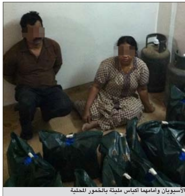
الآسيويان وامامهما اكياس مليئة بالخمور المحلية