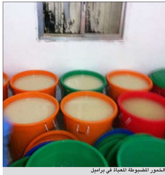
الخمور المضيوبة المعبأة في براميل

وقال مصدر امني ان الحملة التي أمر بها اللواء العلي جاءت بعد معلومات مسبقة وان الفريق الذي انيط إليه تنفيذ تعليمات مدير أمن الفروانية هم رئيس