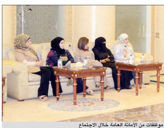
موظفات من الامانة العامة خلال الاجتماع