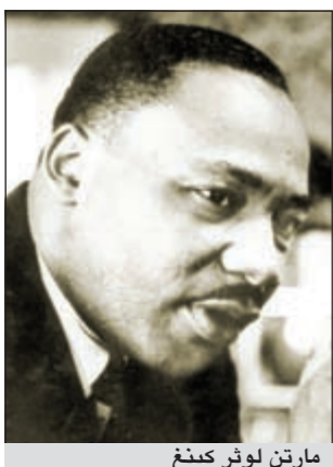
مارتن لوثر كينغ

المفتوح أمام العامة بالقرب من «ناشيونال مول» المساحة الضخمة الواقعة جنوب البيت الأبيض ويجوار النصب التذكارية الخاصة بـ«كينغ» و«جيفرسون» و«روزفلت». ويعتبر هذا النصب التذكاري الأول الذي يشيد تكريماً لشخصية سوداء والوحيد الذي يقام أحياء تكريمي لشخص ليس رئيساً سابقاً للولايات المتحدة. واعتبر هاري جونسون رئيس المؤسسة المسؤولة عن المشروع الذي انطلق قبل 15 عاماً، أن هذا الحدث سيحمل أهمية كبيرة للحضور والمتابعين في البلاد وفي العالم الذين سيشهدون على هذه اللحظة المرتقبة منذ زمن في تاريخ «امتنا».