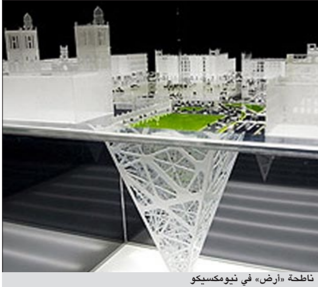
ناطحة «أرض» في نيومكسيكو