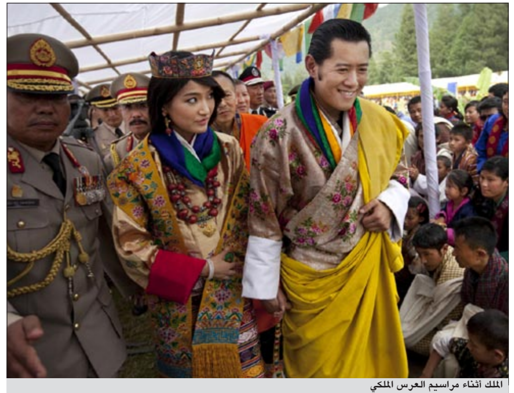
الملك أثناء مراسم العرس الملكي

بجوار الملك فيما أخذ الرهبان يرددون الصلوات ليختتموا العرس الملكي الذي استغرق حوالي ساعتين.