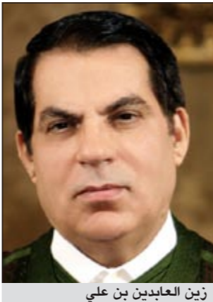
زين العابدين بن علي

وأضافت أن الدراسة أظهرت أن 37٪ من سكان تونس التي يقطنها اليوم أكثر من 10 ملايين ساكن «مصابون بالاكتئاب