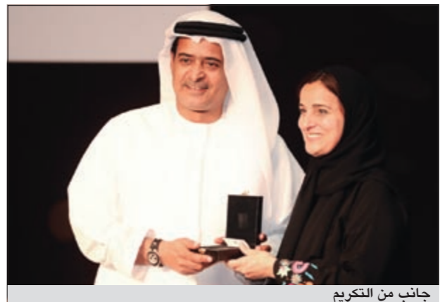
جانين من التكريم