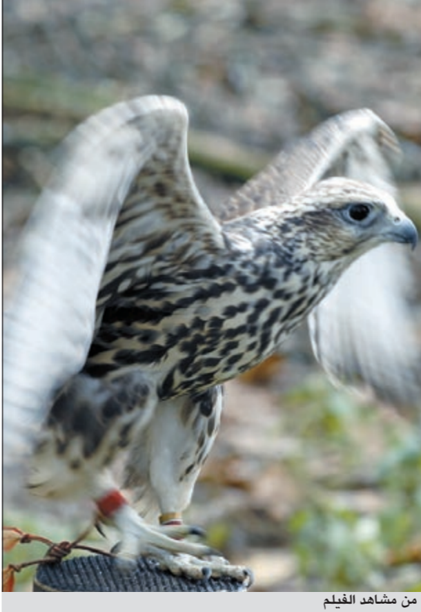
من مشاهد الفيلم

استخدامها للصيد لأنها تنتج داخل المراكز البحثية ولا تؤخذ من الطبيعة كما كان في السابق وهذا يسهم في إنباء عبد الطيور الجوارح، وأوضح ان الفيلم الذي تبلغ مدته 63 دقيقة وصور على مراحل عدة يعتبر وثيقة مرئية حية عن الصيد بالجوارح من خلال الانتقال بالكاميرا الى مناطق نائية في عدد من الدول، وقال المخيل السذي يعد أيضا المنتج للفيلم ان كون المخرج هو المنتج يعطي الفيلم رؤية تكاملية لربط كل خبوطه المعقدة «لكننا استطعنا ان نطرح فكرة جديدة وسلطنا الضوء على نواح جديدة في حياة الطيور الجارحة»، وذكر انه سيتم عرض الفيلم قريبا وسيرافق ذلك معرض «صور مذكرات رحال»، وهي صور مميزة لرحلات المخرج في دول العالم تعرض للمرة الأولى، مبينا ان كل صورة تحمل رؤية وفنا وتاريخا وتوثيقا لا يقل أهمية عن أهمية الصورة المرئية التي تشاهد في الفيلم الوثائقي. وأضاف ان إنتاج «أسياد الأفق» استغرق أكثر من ثلاث سنوات وتم تصويره في