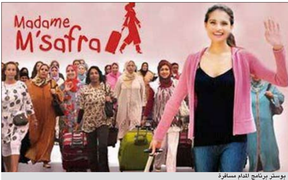
بوسفر برنامج المدام مسافرة

وأثار هذا البرنامج الكثير من الاهتمام لدى جمهور التلفزة، بين من استحسنت فكرة لأنها تبرز قيمة المرأة الزوجة داخل الأسرة خاصة حين غيابها عن البيت، ومن