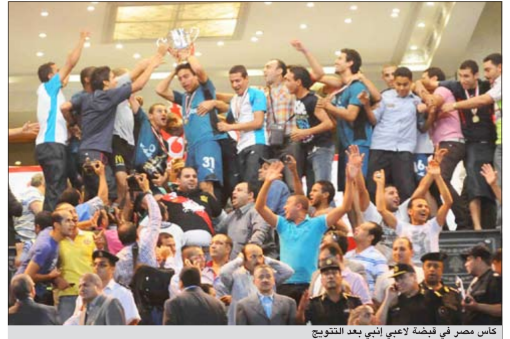
كاس مصر في قبضة لاعبي إنبي بعد التتويج

للإنفاق على قطاع الناشئين وتدريب مواهب جديدة لكرة المصرية. وصبت جماهير الزمالك جام غضبها على رئيس الاتحاد سمير زاهر ورئيس لجنة الحكام عصام صيام وهتفت ضدهم بشدة محملة إياهم مسؤولية فقدان لقب بطولة كاس مصر بسبب اختيارهم لحكم دون المستوى على حسب وصفهم. وقامت الجماهير بالهجوم على المقصورة الرئيسية وهو ما اضطر الأمن للحفاظ على كبار الشخصيات والمسؤولين بغرفة كبار الزوار لحين خروج الجماهير الغاضبة.