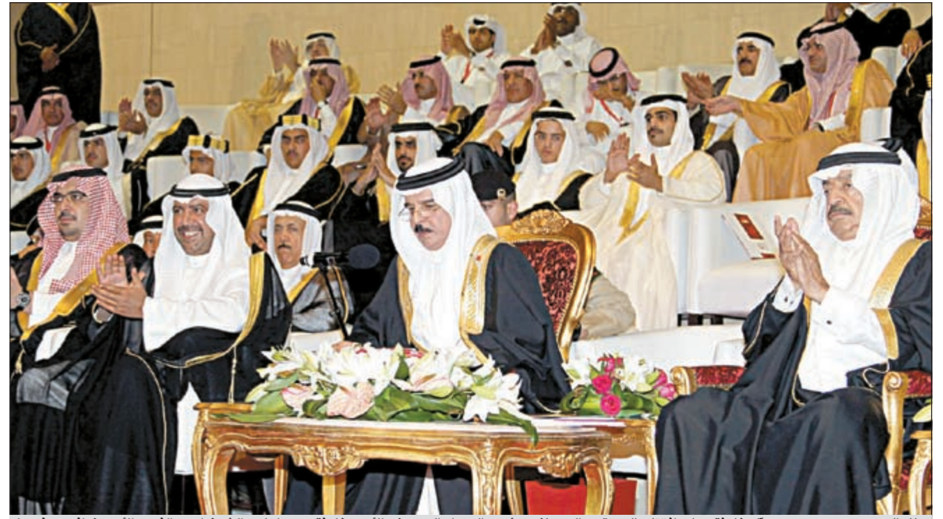
ملك البحرين حمد بن عيسى آل خليفة يعلن افتتاح الدورة... وإلى جانبه رئيس الوزراء البحريني الأمير خليفة بن سلمان والشيخ أحمد الفهد والأمير نواف بن فيصل

لقائمين خسرو مع المنتخب البحريني وحقق الفوز في اللقاء الثاني مع المنتخب العماني.