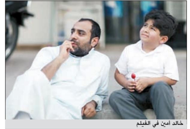
خالد أمين في الفيلم