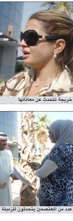
خريجة تتحدث عن معاناتها

مقتنعة بالحلول المطروحة نظراً لما نراه من تسويق ومماثلة، لافتاً إلى أن هناك مصالح خاصة أدت إلى تهيميش قضية الطلبة، وأوضح الكونكوسي أن الوزير المليفي كان شجاعاً عندما اعترف بمسؤولية التعليم العالي عن هذا الملف وانتظر بمقابلة الوزير أحمد المليفي، موجهاً جزيل الشكر إلى بعض نواب مجلس الأمة الذين يساندون قضيتهم، موضحاً أن الحساب الرسمي لرابطة خريجي الجامعات الموقوفة على تويتر هو @uv_kuwait.