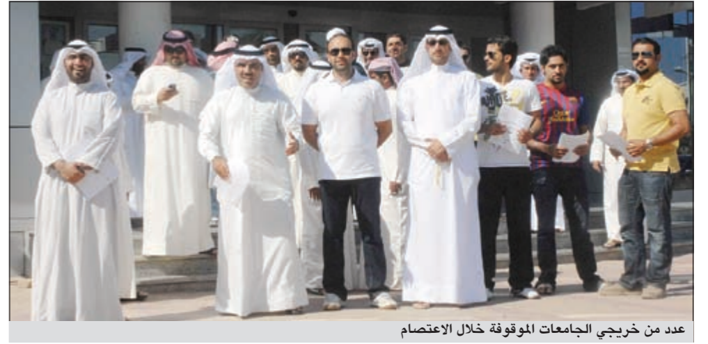
عدد من خريجي الجامعات الموقوفة خلال الاعتصام