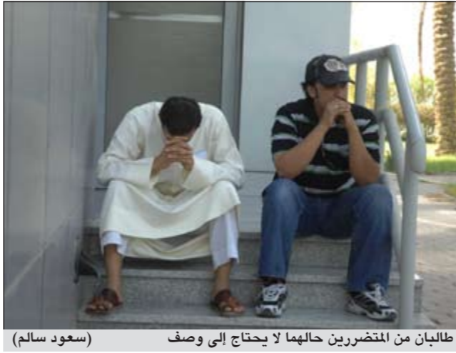
طالبان من المتضررين حالهما لا يحتاج إلى وصف