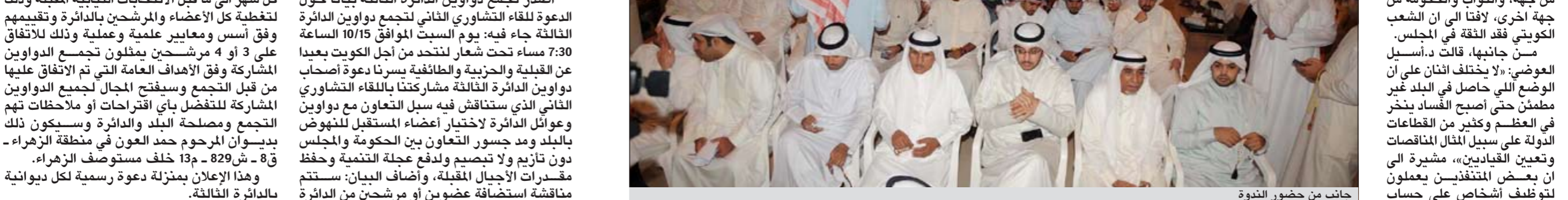
جانب من حضور الندوة

أصدر تجمع دواوين الدائرة الثالثة بياناً حول الدعوة للقاء التشاوري الثاني لتجمع دواوين الدائرة الثالثة جاء فيه: يوم السبت الموافق 10/15 الساعة 7:30 مساء تحت شعار لنتحذ من أجل الكويت بعيداً عن القبلية والحزبية والطائفية يسرنا دعوة أصحاب دواوين الدائرة الثالثة مشاركتنا باللقاء التشاوري الثاني الذي سنتناقش فيه سبل التعاون مع دواوين دواوين الدائرة لاختيار أعضاء المستقبل للنهوض بالبلد ومد جسور التعاون بين الحكومة والمجلس دون تازيم ولا تبصيص ولدفع عجلة التنمية وحفظ مقدرات الأجيال المقبلة، وأضاف البيان: سستتم مناقشة استضافة عضوين أو مرشحين من الدائرة