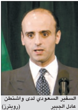
السفير السعودي لدى واشنطن عادل الجبير

الرياض - واس: استمرارا للفحوصات الطبية المجدولة التي يجريها خادم الحرمين الشريفين الملك عبدالله بن عبدالعزيز خلال الفترة الماضية بعد شعوره بالام في أسفل الظهر، فقد اجريت له الفحوصات اللازمة وتبين وجود تراخ في الرباط المثبت حول الفقرة الثالثة، وقد قرر الأطباء ضرورة إجراء عملية لإعادة تثبيت ذلك التراخي وستجرى العملية خلال الايام المقبلة في عاصمة المملكة الرياض.