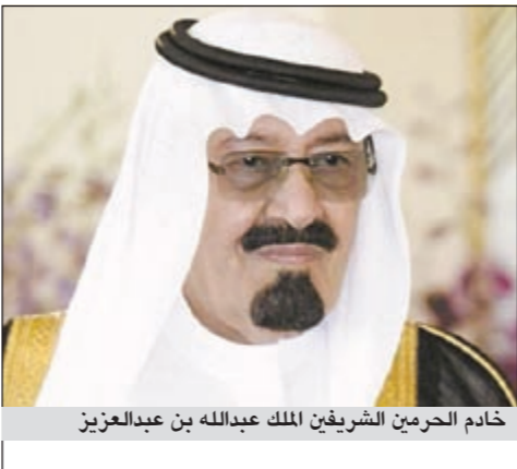
خادم الحرمين الشريفين الملك عبدالله بن عبدالعزيز

ورأى سلمان ان هذه المطالب تلتف حولها المعارضة المكونة من نسيج اجتماعي بحريني يشكل الاغلبية السياسية، واذا