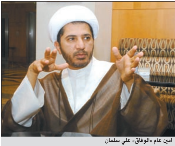
أمين عام «الوقاف» على سلمان

أكدت المعارضة البحرينية انها لا تتبنى شعار إسقاط النظام بل تطالب باصلاحه وتطويره نحو نظام ديموقراطي في حين فرقت قوات الامن البحرينية عشرات المتظاهرين الذين كانوا يحاولون الخروج في مسيرة احتجاجية.