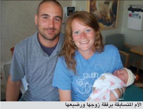
الأم المتسابقة برفقة زوجها ورضيعها

شيكاغو - يو.بي.أي: تشبه الكثير من النساء المخاض الذي يعانين منه الإنجاب طفل بالماراثون. لكن امرأة في شيكاغو لم تتكيف بالتشبيه بل ركضت فعلا في ماراثون لأكثر من ست ساعات ولدى وصولها إلى خط النهاية بدأت الولادة.