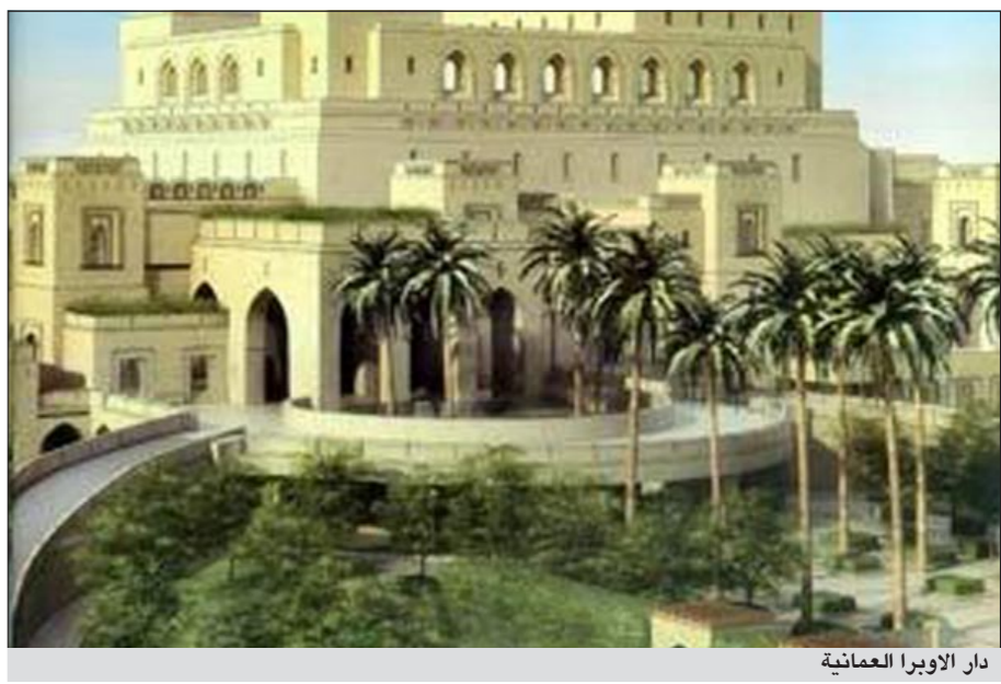
دار الأوبرا العمانية

يافتح السلطان قابوس بن سعيد اليوم الأربعاء في مسقط دار الأوبرا الأولى من نوعها في منطقة الخليج، ليحقق حلمه الشخصي بإنشاء صرح للموسيقى الكلاسيكية العزيزة على قلبه وتحفة معمارية تربط بين الثقافة الإسلامية والموسيقى العالمية. وترتفع دار الأوبرا بلونها الأبيض كقلعة تجمع بين الضخامة والرفقة في مقابل مبنى وزارة الخارجية العمانية على الشارع الرئيسي في مسقط وصممت الدار حسب نمط العمارة العربية والإسلامية، كما أن شكلها الخارجي مستوحى من نمط القلاع العمانية.