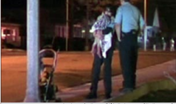
أحد رجال الأمن يحمل الطفلة بعد العثور عليها