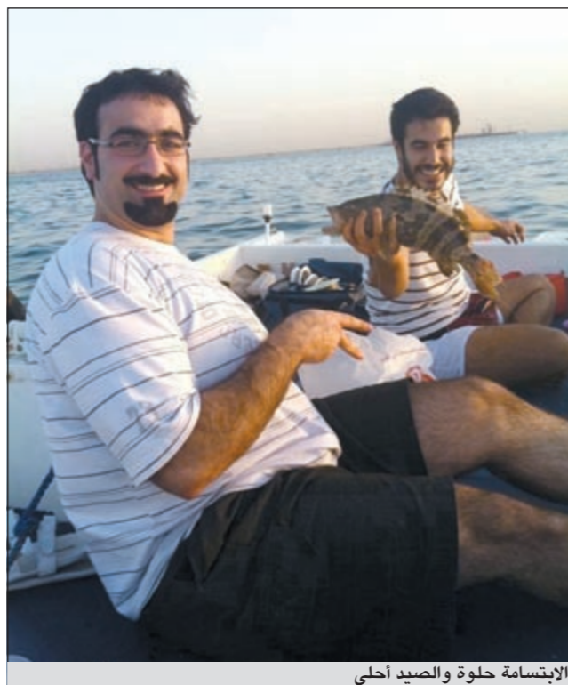
الابتسامه حلوة والصيد أحلى