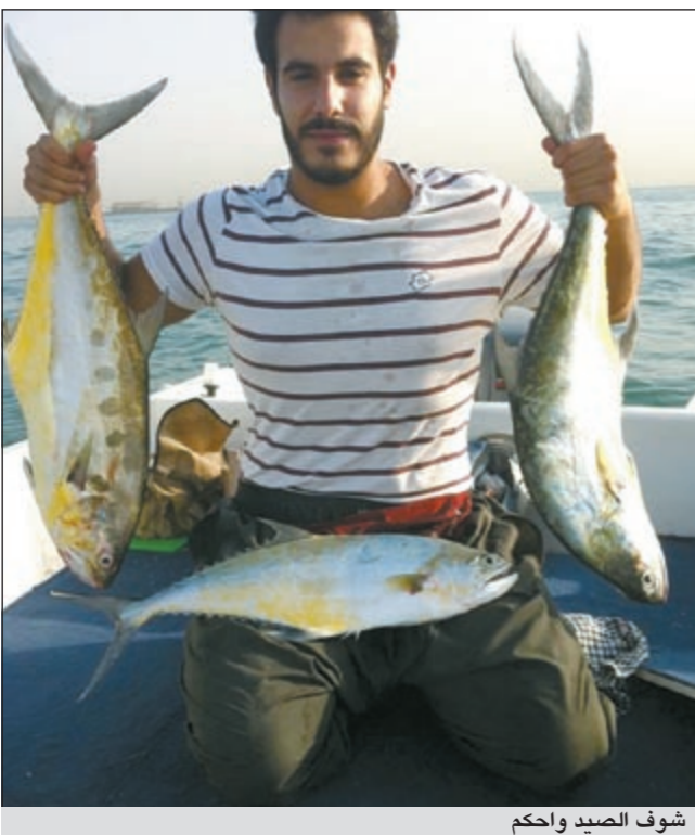
شوف الصيد واحكم