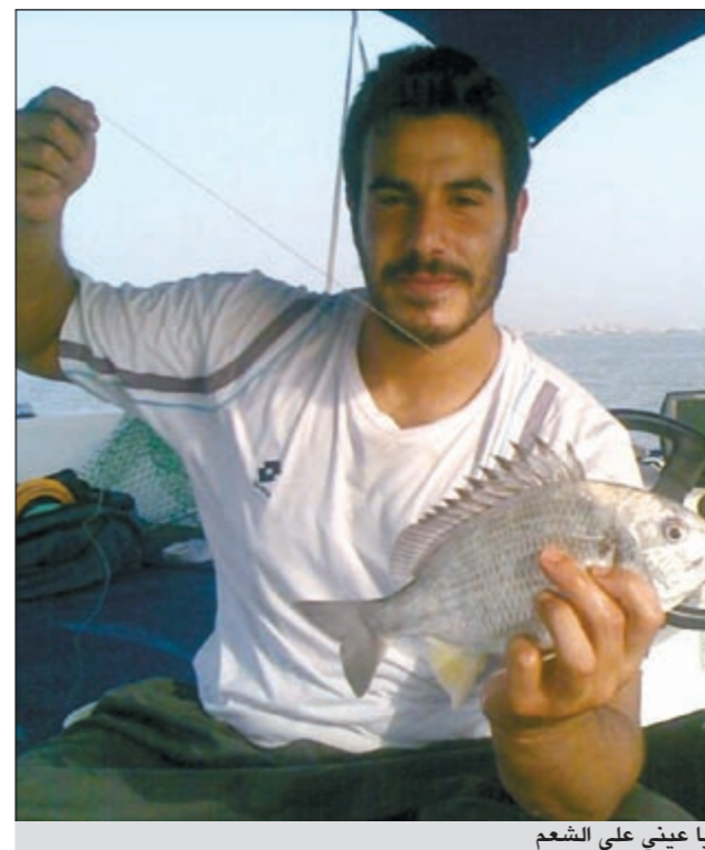
يا عيني على الشعمر