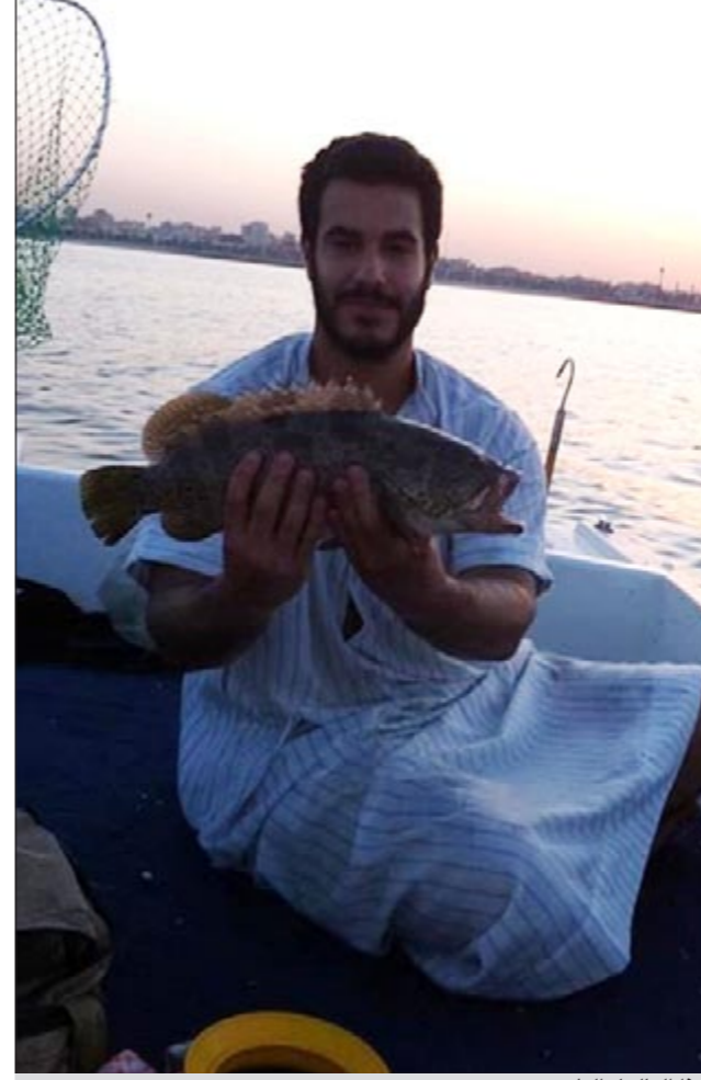
هذا بالبول الطيب