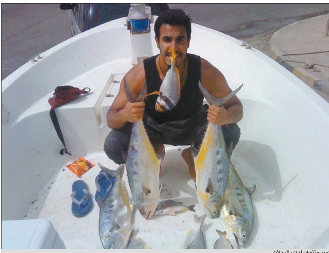
صيد متنوع بإحدى الرحلات

● احب ان أوجه دعوتي الى اخواني الحداقة وارجو منهم المحافظة على بحرننا الغالي وعدم رمي العلب والأكياس الفارغة به كما ادعوهم الى الاهتمام بعودة السلامة والإسعافات الأولية كاملة دون نقصان وفي الختام ادعو للجميع بالصيد الوفير والسلامة.