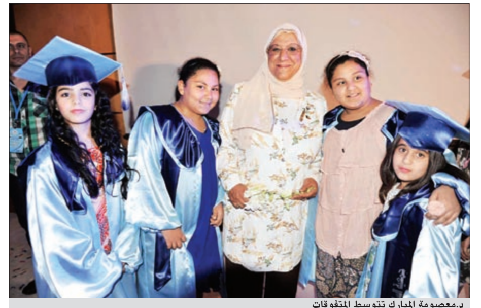
د. معصومة المبارك تتوسط المتفوقات