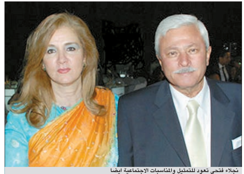
نجلاء فتحي تعود للتمثيل والمناسبات الاجتماعية أيضا

بعد غياب سنوات، عادت نجلاء فتحي إلى الضوء من خلال مشاركتها في العديد من المناسبات الاجتماعية، إذ حضرت زفاف أحد أصدقائها. وبدت علامات السن على النجمة المصرية التي لم تلجأ إلى أي عملية تجميل مثل فنانات جيلها، ويتردد أن عودة فتحي إلى الأضواء تتزامن مع عودتها إلى التمثيل أيضا بعد الثورة المصرية، ووافقت الممثلة على