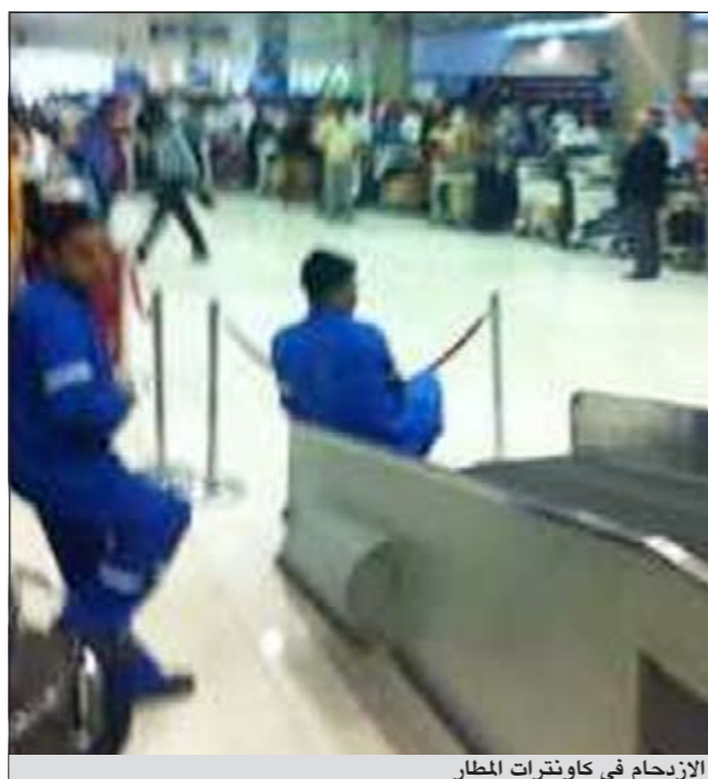
الازدحام في كاونترات المطار

نفى مصدر نفطي مسؤول في مؤسسة البترول الكويتية لـ «الأنباء» تأثر صادرات النفط الكويتية جراء الإضراب الذي قام به موظفو الجمارك أمس، مشيراً إلى أن شركتي نفط الكويت والبترول الوطنية أعدتا خطة محكمة لضمان سير عمليات التصدير بكل مرونة وسهولة خلال الإضراب أمس. وقال المصدر أن دور الجمارك في موانئ النفط هو إعطاء إذن التحميل ودخول الشاحنة إلى الميناء لبدء تحميل النفط أو المشتقات النفطية وكذلك إعطاء هذه البواخر تصاريح الخروج، مشيراً إلى أن الإشكالية الحالية هي إذن خروج البواخر. وقال إن شركتي البترول الوطنية والنفط الكويت طلبتا أمس من البواخر الابتعاد بمسافة لا تقل عن 3 كيلومترات عن الموانئ وذلك لتسهيل دخول البواخر الأخرى ومنعاً للازدحام. وشدد المصدر على أنه في حالة استمرار إضراب موظفي الجمارك لمدة 3 أيام سيكون له تأثير كبير على عمليات التصدير وستلجأ مؤسسة البترول الكويتية إلى وقف عمليات تصدير النفط والمشتقات النفطية. وبين المصدر أن شركة نفط الكويت قامت أمس بتحميل أكثر من باخرة في ميناء الأحمدى، مشيراً إلى أن عمليات التصدير في مرسى الرحوي في عمق الخليج العربي لم يتأثر إطلاقاً وعمليات التحميل للبواخر تتم بكل مرونة. وشدد المصدر على أن تواجد موظفي الجمارك في موانئ تصدير النفط هو تواجد شكلي لحماية المنافذ البحرية من دخول اجانب بطريقة غير شرعية للكوكيت فقط وليس لهم أي تدخل في صادرات النفط الكويتية للخارج. ونكر أن رجال الجمارك يقومون بالتدقيق على شخصيات البحارة الذين يدخلون المياه الإقليمية للكوكيت عبر ناقلات النفط العالمية وهو إجراء شكلي ولا يوجد لهم دور في تصدير النفط او غيره من المواد البترولية المكررة التي تصدر من مصافي شركات البترول الوطنية الثلاث.