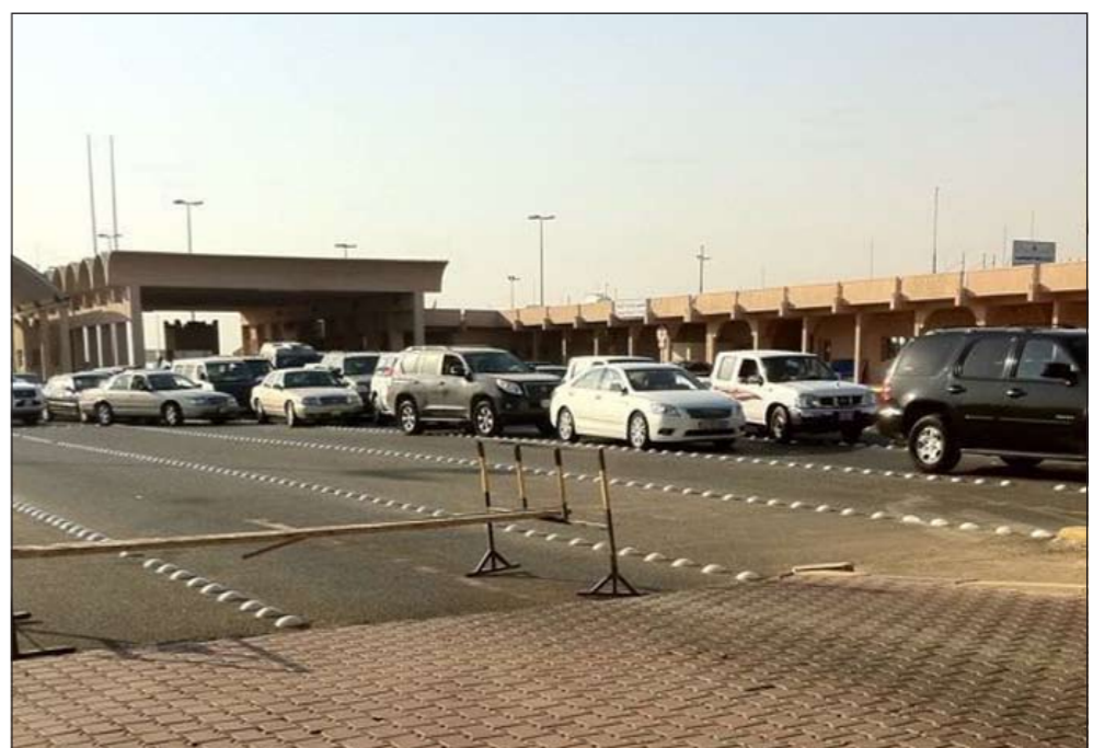
ازدحام شديد امام منفذ دخول النوصيب ظهر امس