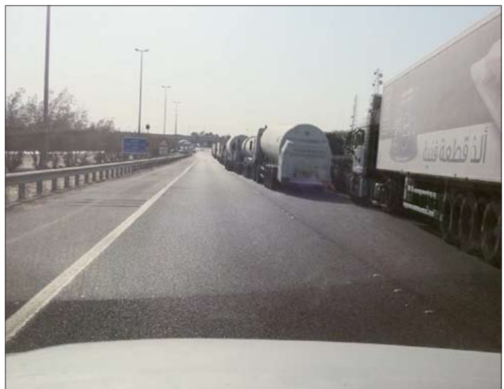
الشاحنات اصطفت بفعل الاعتصام على مسافة عدة كيلومترات