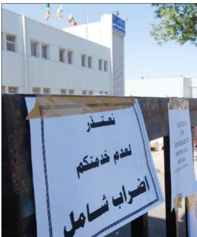
لافتة علقت امام مركز جمارك المطار