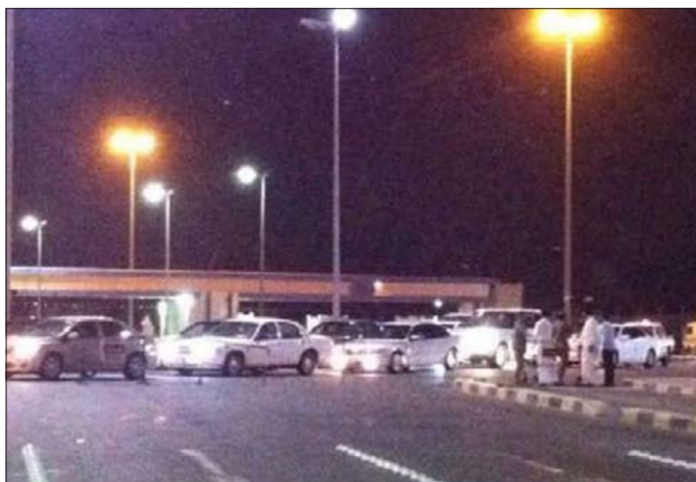
الازدحام في منفذ النوصيب بدأ فجر امس مع دخول الإضراب حيز التنفيذ باكراً