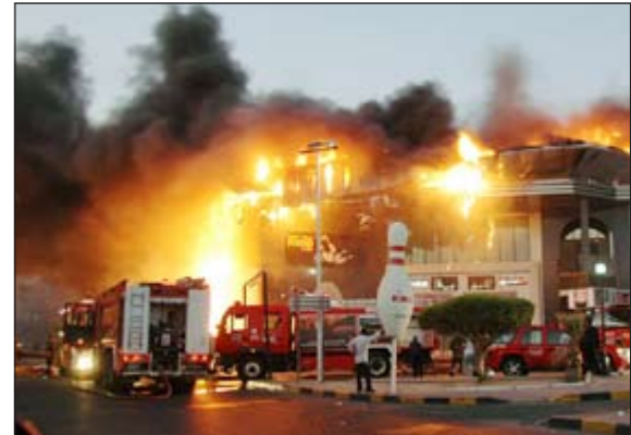
البيات الاطفاء خلال تعاملها مع حريق المجمع

وقال مدير ادارة العلاقات العامة في الاطفاء المقدم خليل الامير ان بلاغا بحريق تلقته عمليات الداخلية فجر امس حيث تم ارسال مراكز اطفاء السالمية الشمالي والجنوبي والمدينة وتبين لدى وصول رجال الاطفاء ان الحريق بدأ في محول وتم اخماد السنة اللهب في المحول بعد فصل التيار الكهربائي وتزامن هذا الاجراء مع جهود لخماد النيران في واجهة المجمع واقتصرت الخسائر على مادية.