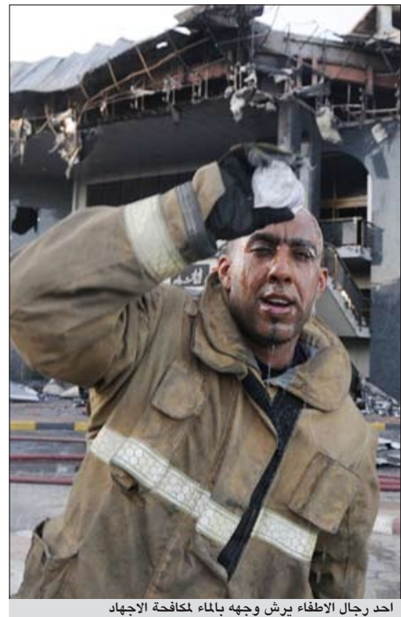
احد رجال الاطفاء يرش وجهه بالماء لمكافحة الاجهاد