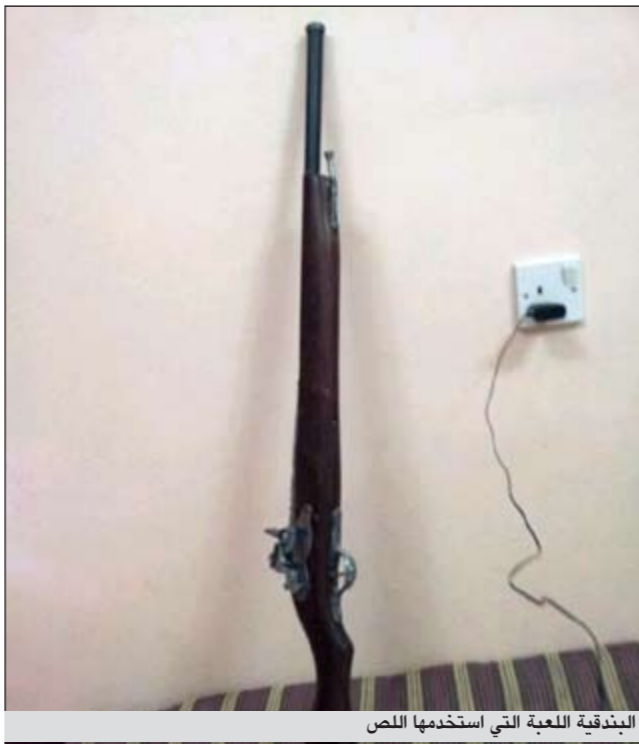
البنديقية اللعبة التي استخدمها اللص

الذي ألقى القبض عليه المواطن صاحب المنزل تبين انه سيلاني ولم يعثر معه على شيء، وعلق المصدر قائلا: لا شك ان حيلة المواطن كانت ذكية جدا، رغم المخاطرة التي كانت تحدى به