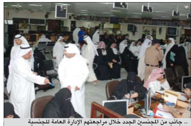
.. جانب من المجلسين الجدد خلال مراجعتهم الإدارة العامة للجنسية

مادة 17 في حال كانت بحوزتهم 227 ليصل اجمالي الذين تم استقبالهم امس وأول من امس كامل المستحقين لشرف الجنسية الكويتية.