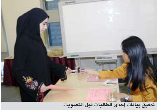
تدقيق بيانات إحدى الطالبات قبل التصويت