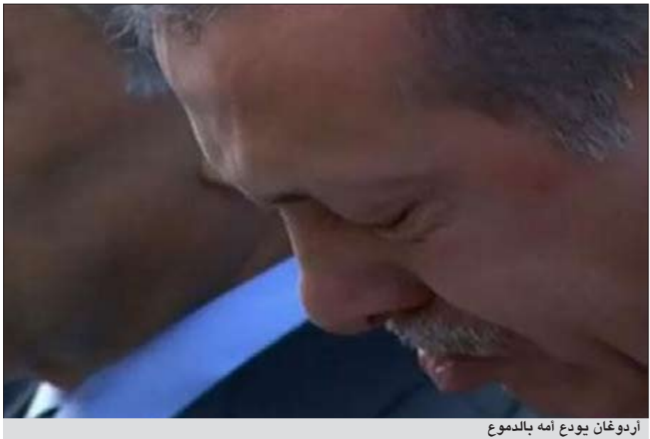
أردوغان يودع أمه بالدموع

رئيس الوزراء، تعيش في شقتها في حي قاسا باشا الشعبي في اسطنبول. إذ رفضت الانتقال من منزلها، حتى بعد تولي ابنها رئاسة الوزراء. فيما كان أردوغان يحرض على لقاء والدته، وعرف عنه شدة تعلقه بها. إلى ذلك، أوكل الرئيس الإيراني حمدي نجاد نائبه الأول محمد رضا رحيمي بإرسال برقية تعزية لرئيس الوزراء التركي رجب طيب أردوغان بفقدته لوالدته تنزيلاً لأردوغان. في الوقت الذي لوحظ عدم مكالمته لأردوغان هاتفياً لتقديم التعزية له كما فعل رؤساء غالبية الدول العالمية والحليفة لتركي. وجاء في بيان صادر عن المكتب الإعلامي لرئاسة الجمهورية الإسلامية الإيرانية أن رحيمي أعرب في برقيته عن خالص عزائه ومواساته لرئيس الوزراء التركي، سائلاً الله العلي العظيم أن يتغمّد الفقيدة بواسع رحمته وأن يسكنها فسيح جناته وأن يلم أهله وذويها الصبر والسلوان.