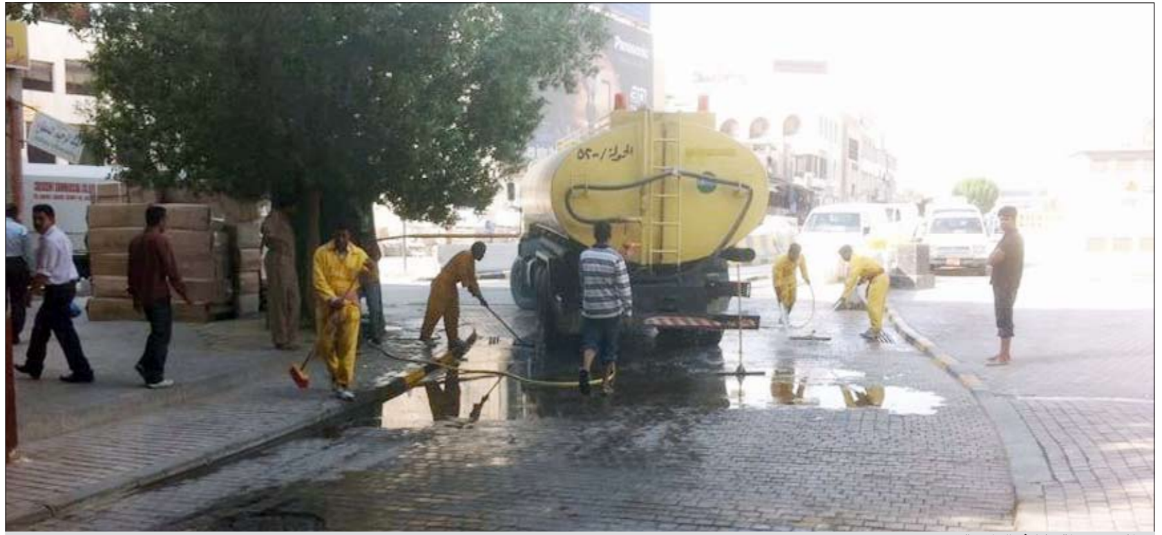
جانب من حملة تنظيف العاصمة