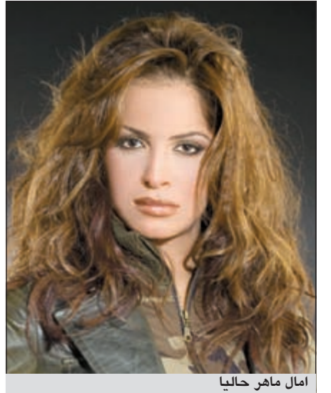
أمال ماهر حالياً

السلي أنها لم تكن راضية عن أي ظهور لها في كليياتها السابقة، لكنها أصبحت اليوم قادرة على رفض أي «لوك» لا يتلاءم مع شخصيتها وملامحها.