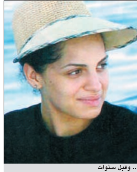
.. وقيل سنوات