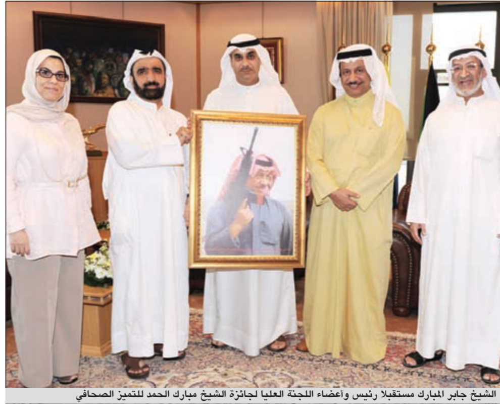
الشيخ جابر المبارك مستقبلاً رئيس وأعضاء اللجنة العليا لجائزة الشيخ مبارك الحمد للتميز الصحفي

وأضاف أن الشيخ جابر المبارك أبدى استعداداه الكامل للعمل على تطوير هذه الجائزة ودعمه لكل ما يمكن أن يرتقي بالعمل الصحفي من خلال