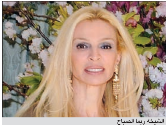
الشيخة ريماء الصباح

واشنطن - كونا: صنفت زوجة سفيرنا لدى الولايات المتحدة الشيخة ريماء الصباح من قبل مجلة بارزة في واشنطن كواحدة من أبرز 100 امرأة في العاصمة الأميركية نظراً لجهودها في المجال الإنساني والأعمال الخيرية وذلك للمرة الثانية على التوالي. ووقع الاختيار على الشيخة ريماء الصباح كونها واحدة من أنشط مضيفات واشنطن حيث قامت بجهود مشتركة مع زوجها السفير الكويتي في واشنطن جمعت فيها ما يزيد على 11 مليون دولار في السنوات السبع الماضية.