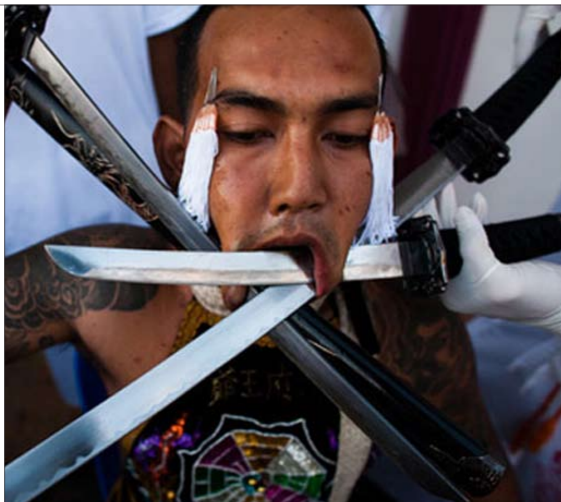
مزق وجهه بالسيف بحثا عن تطهير نفسه بحسب المعتقد السائد في جزيرة بوكيت