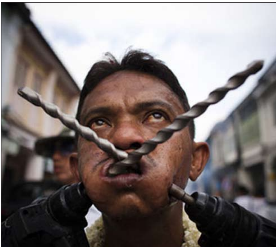
.. وآخر وضع متقابين في وجنتيه خلال الاحتفال