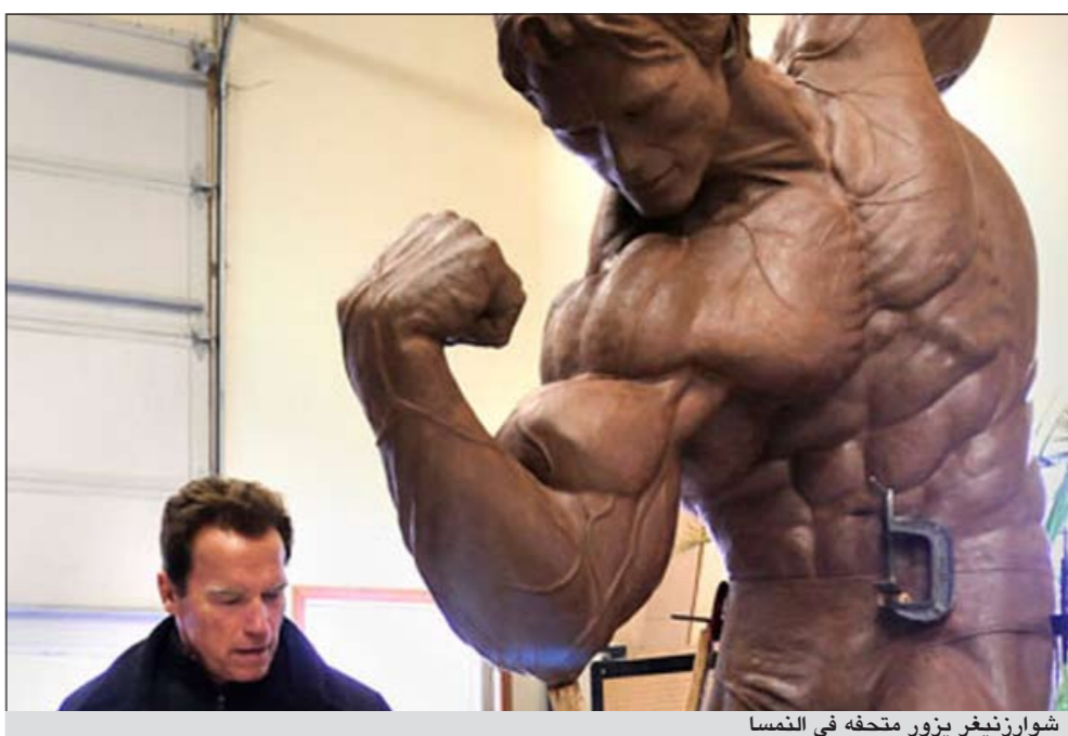
شوارزنيغر يزور متحفه في النمسا

فيينا - د.ب.أ: زار أرنولد شوارزنيغر، الممثل وحاكم ولاية كاليفورنيا السابق، قبر والدته في فين قرب غراتس بالنمسا وذلك قبل ساعات من موعد افتتاح المتحف الذي أنشئ تكريما له امس. وذكرت وكالة انباء «ايه.بي.ايه» النمساوية أن شوارزنيغر زار معالم مسقط رأسه وبصحبة ابنه باتريك يوم الخميس الماضي، وكان محاطا بالمعجبين