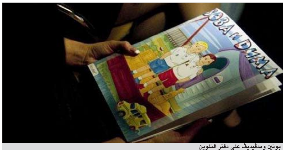
بوتين ومدفيدف على دفتر التلوين

موسكو - أ.ف.ب: أصبح طفلان صغيران يلعبان معا ويشبهان رئيس الوزراء الروسي فلاديمير بوتين والرئيس ديميتري مدفيدف بطلي دفتر التلوين موجه للأطفال عرض موسكو. وعرضت الناشران ماكسيم برلين وفلاديمير تاباك الكتاب عشية عيد ميلاد فلاديمير بوتين الذي احتفلت امس ببلوغه التاسعة والخمسين. كتاب التلوين الواقع في 14 صفحة مع مشاهد تعكس حياة الطفلين «فوقا» و«ديما» طبع 25 ألف نسخة منه وبياع بسعر 150 روبل (4.6 يورو) على ما اصدره المؤلفون. وأوضح فلاديمير تاباك ان «دفتر التلوين حول فوقا وديما (وهما تصغير لاسمي فلاديمير ودميتري) سيباعان في كل المكتبات الرئيسية داخلية مثيرة.