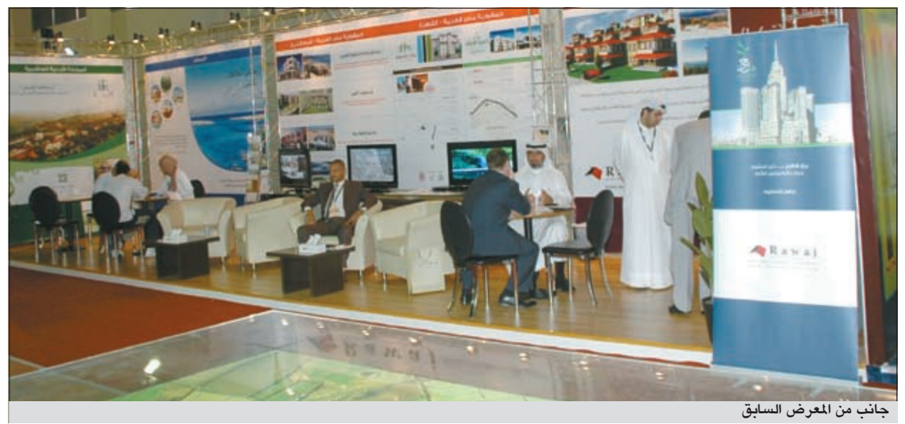
جانب من المعرض السابق

وتنقل أسعار النفط الخام بعيداً من التذبذب بين صعود وهبوط في محيط الـ 100 دولار للبرميل منذ بداية العام الحالي نتيجة الأحداث السياسية والاقتصادية المتسارعة. ومن أبرز ما أثر في الأسعار خلال الفترة الماضية ما تشهده منطقة الشرق الأوسط من اضطرابات وفورات تسببت في توقف إمدادات النفط الليبي المقدر بـ 1,6 مليون برميل يوميا من نوعية ممتازة من النفط إضافة إلى حدوث أكبر كارثة نووية في اليابان المعروفة بحادثة محطة فوكوشيما إلى جانب الأزمة في الديون السيادية التي تعيشها منطقة اليورو والاضطراب الحاصل في الاقتصاد الأميركي.