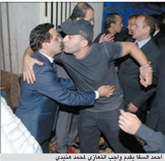
أحمد السقا يقدم واجب العزاء لمحمد هندي

وكان السقا قد أجرى للتو عملية جراحية في قدمه بعدما سقط خلال قيامه ببعض التمارين الرياضية ونصح الأطباء بالتزام الراحة وعدم الاجهاد حتى التئام الجرح.