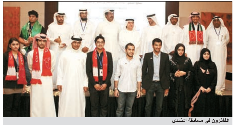
الفائزون في مسابقة المنتدى

دبي - كونا: اختتمت الليلة قبل الماضية فعاليات المنتدى الإعلامي الشبابي الخليجي الأول بإعلان الأسماء الفائزة بجوائز في «مسابقة الإعلام الشبابي» وبإصدار توصيات تصب في صالح المنتدى المقبلة.