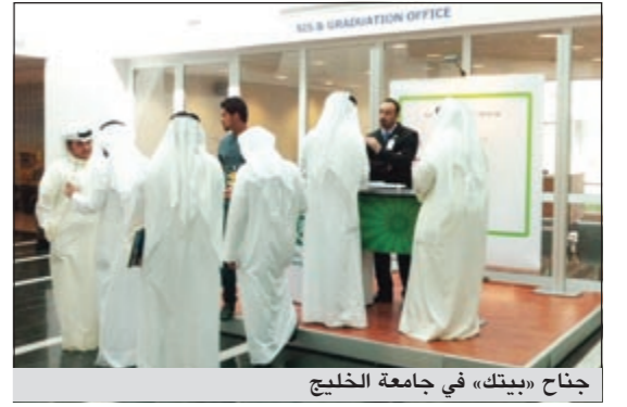
جناح «بيتك» في جامعة الخليج

يتواجد بيت التمويل الكويتي (بيتك) في جامعة الخليج للعلوم والتكنولوجيا من خلال جناح خاص لتسويق أبرز خدماته ومنتجاته التي تناسب تطلعات شريحة الشباب من طلاب الجامعات، ومن بينها فتح الحسابات البنوكية والبطاقات المصرفية، كما يمنح «بيتك» طلاب الجامعة وأعضاء هيئة التدريس والموظفين أعضاء الهيئة الإدارية منابا وعروضاً حصرية أهمها بطاقة الخير مسجلة الدفع مجاناً عند إجراء أي معاملة. ويحرص «بيتك» على التواجد في جامعة الخليج للعلوم