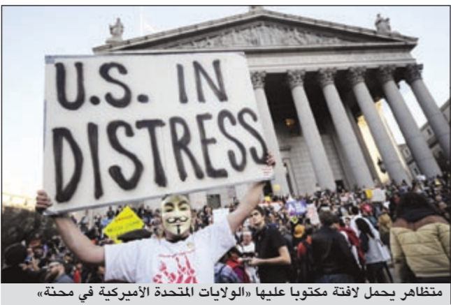
متظاهر يحمل لافتة مكتوباً عليها «الولايات المتحدة الأميركية في محنة»

يسمون ذلك أعمالاً، وعندما يدافع الفقراء عن أنفسهم، يسمون ذلك عنفاً، و«فلننقض على جشع وول ستريت قبل ان تقضي على العالم». وسار الموكب الذي ضم العديد من الشبان والمرضات، بفرح تحت أشعة شمس حارقة على وقع الطبول. ولقي هؤلاء المتظاهرون دعم منظمات نقابية عدة ومجموعات محلية ونواب ديمقراطيين. وتدد بعض المتظاهرين بـ «جشع وول ستريت»، في حين ندد آخرون بالاحتباس الحراري وآخرون بأعمال العنف التي تقوم بها الشرطة. وتستخدمت الحركة إلى شبكات اجتماعية على الإنترنت لنشر رسالتها. وتقدم الحركة نفسها على أنها «حركة مقاومة من دون قيادة» وانها غير عنفية. وأوضح موقعها الإلكتروني «نحن الـ 99٪ الذين لن يتسألوا طويلاً حيال جشع وفساد الـ 1٪ (الأخريين)».