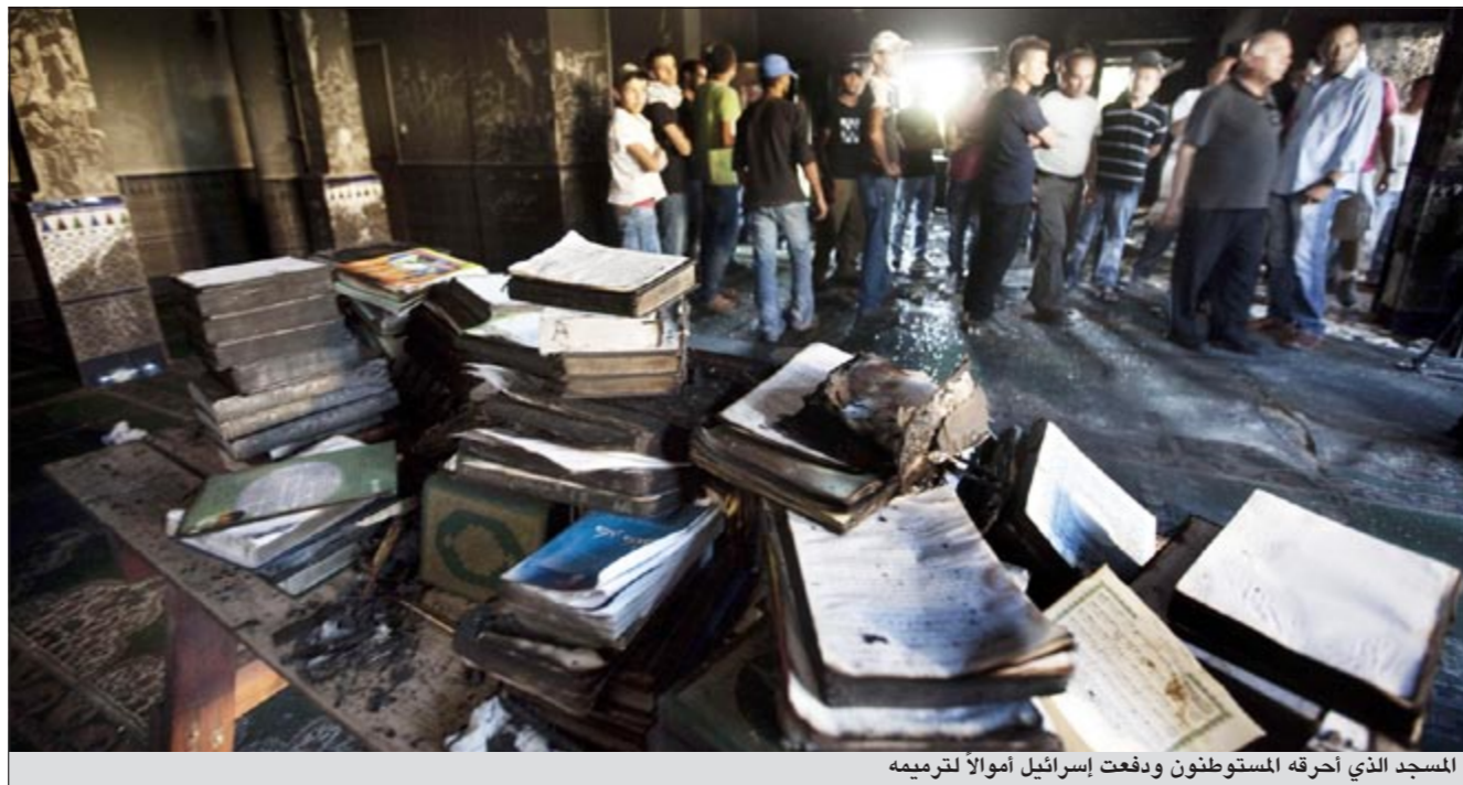
المسجد الذي حرقه المستوطنون ودعت إسرائيل أموالاً لترميمه