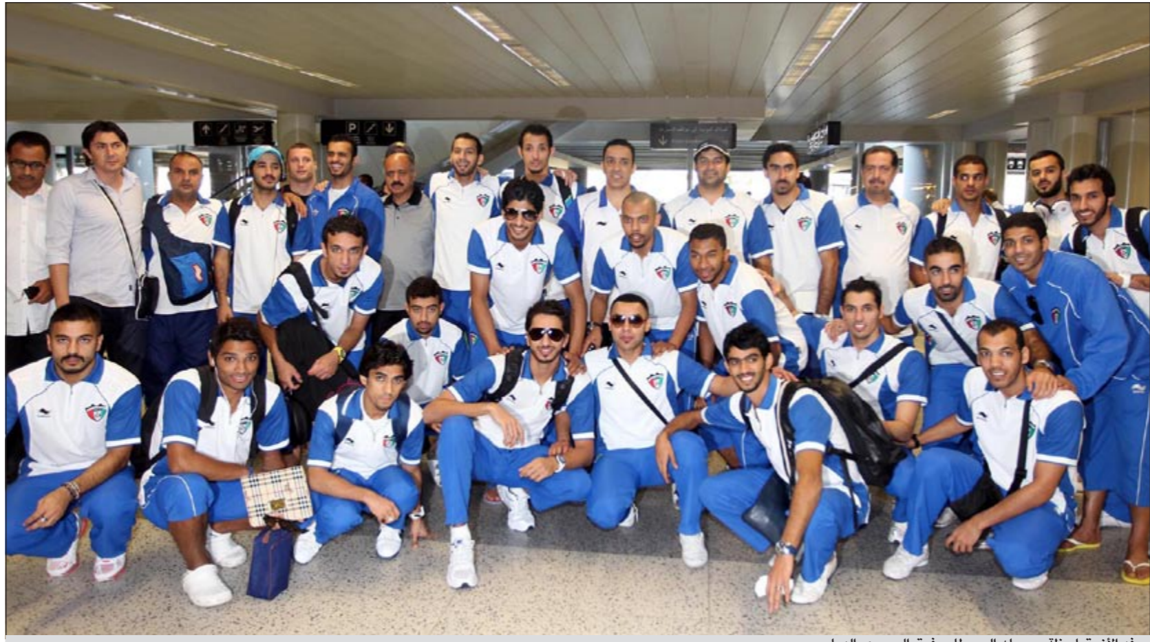
وفد الأزرق لحظة وصوله إلى مطار رفيق الحريري الدولي

وصلت الى بيروت في الثالثة والنصف بعد ظهر أمس بعثة المنتخب الوطني، للقائه منتخب لبنان 11 الجاري على ملعب مدينة كميل شمعون الرياضية، في ختام مرحلة الذهاب للدور التمهيدي الثالث للتصفيات الآسيوية المؤهلة لنهائيات كأس العالم 2014 بالبرازيل.