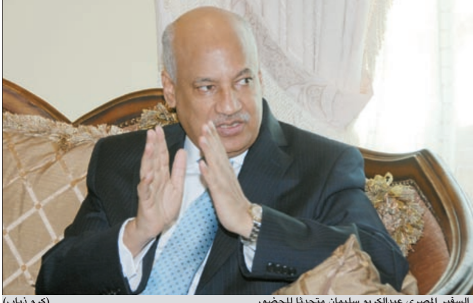
السفير المصري عبدالكريم سليمان متحدثاً للحضور

مناسبة 6 أكتوبر التي اعتبرها مرحلة عبور من الهزيمة والمرارة إلى النصر وانطلاق عهد جديد في التاريخ المصري، وقد تميزت هذه الفترة بتماسك الجبهة الداخلية وصلابتها، مشيداً بالدعم العربي لمصر في كل الأوقات.