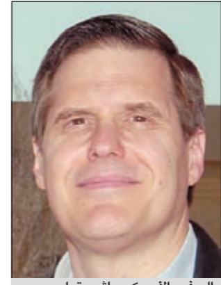
السفير الأميركي ماثيو تولر

شدد السفير الأميركي الجديد بالكويت ماثيو تولر على أهمية العلاقة على جميع المستويات بين الولايات المتحدة الأميركية والكويت، وقال السفير تولر في إجابة عن سؤال - كما نقل موقع «الآن» - حول بعض التصريحات العراقية البرلمانية بتخلي الولايات المتحدة الأميركية عن الكويت في حال نشوب خلاف مع العراق - لا سمح الله - لأن الولايات المتحدة اليوم أصبحت حليفاً وصديقا للعراق، أن ما تم بناؤه من علاقات متميزة بين الكويت والولايات المتحدة على مدى العشرين سنة الماضية لن يتلاشى بتصريحات هنا أو هناك، وأن الولايات المتحدة تفضل علاقاتها المهمة مع الكويت على كل الصعد ولن تتخلى عن الوقوف إلى جانب الكويت التي تربطها بها معاهدات واتفاقيات متعددة. وأضاف: الموقف