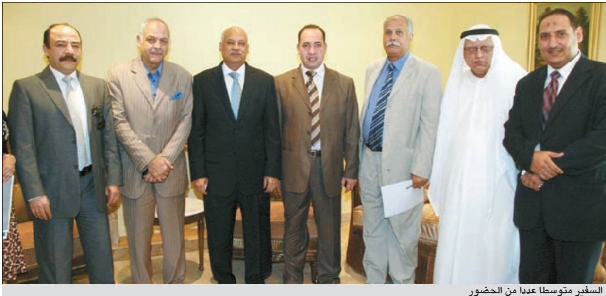
السفير متوسلاً عدداً من الحضور