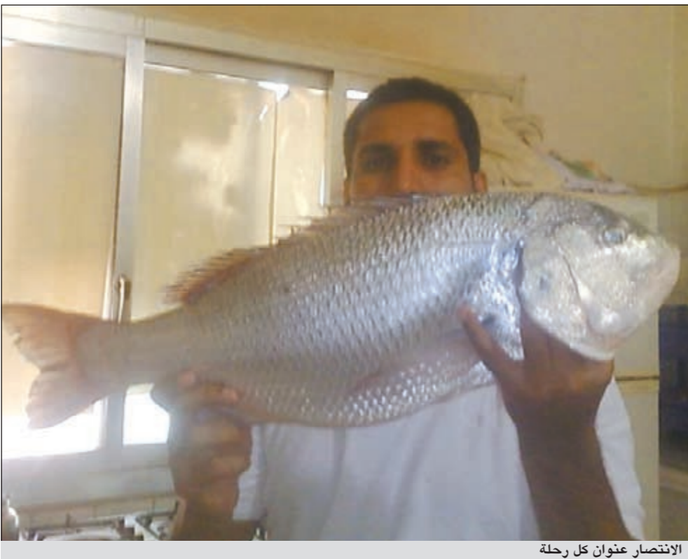
الانتصار عنوان كل رحلة