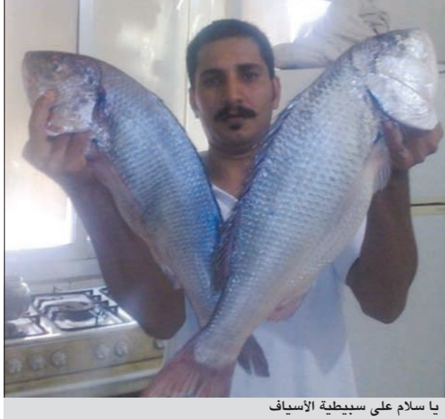
يا سلام على سبيطية الأسياف

دعوة تحب ان توجهها وإلى من؟ ● أوجه دعوتي الى اخواني الحدائق وارجو منهم المحافظة على بحرننا الغالي وعدم رمي العلب والأكياس الفارغة به كما ادعومهم الى الاهتمام بعودة السلامة والإسعافات الأولية كاملة دون نقصان وفي الختام ادعو للجميع بالصيد الوفير والسلامة.