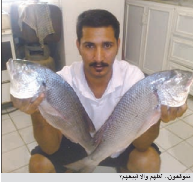
تتوقعون.. اكلهم والا ابيعهم؟

ما اكبر كمية صيد كانت لك؟ ● اذكر في احصى الرحلات