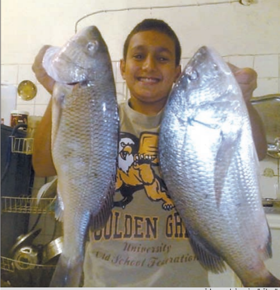
الحدائق الصغير وأحلى سبيطية