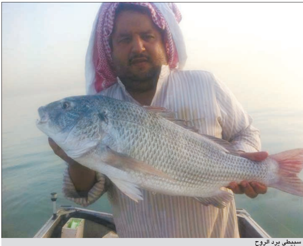
سبيطي يرد الروح