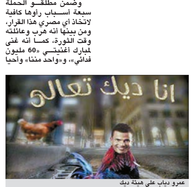
عمرو دياب على هيئة ديك

تصدرت صورة ساخرة للنجم المصري عمرو دياب تم تركيبها على جسم ديك حملة مناهضة لألبومه الجديد على موقع «فيسبوك»، فيما أنهم محبوهم أنصار المطرب تامر حسني بالوقوف وراء الحملة. وجاء اختيار «الديك» - كما يتضح من الصورة - استناداً