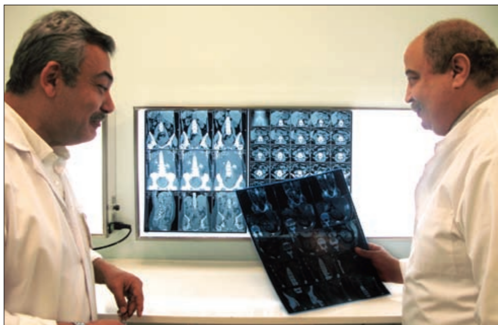
أثناء فحص أشعة مريض بالتشاور مع استشاري الأشعة

وقد أجرى 60 بحثاً علمياً نشرت عالمياً، ولديه أربعة كتب، وشارك في تأسيس الجمعية الأوروبية لجراحة الأعضاء التناسلية.