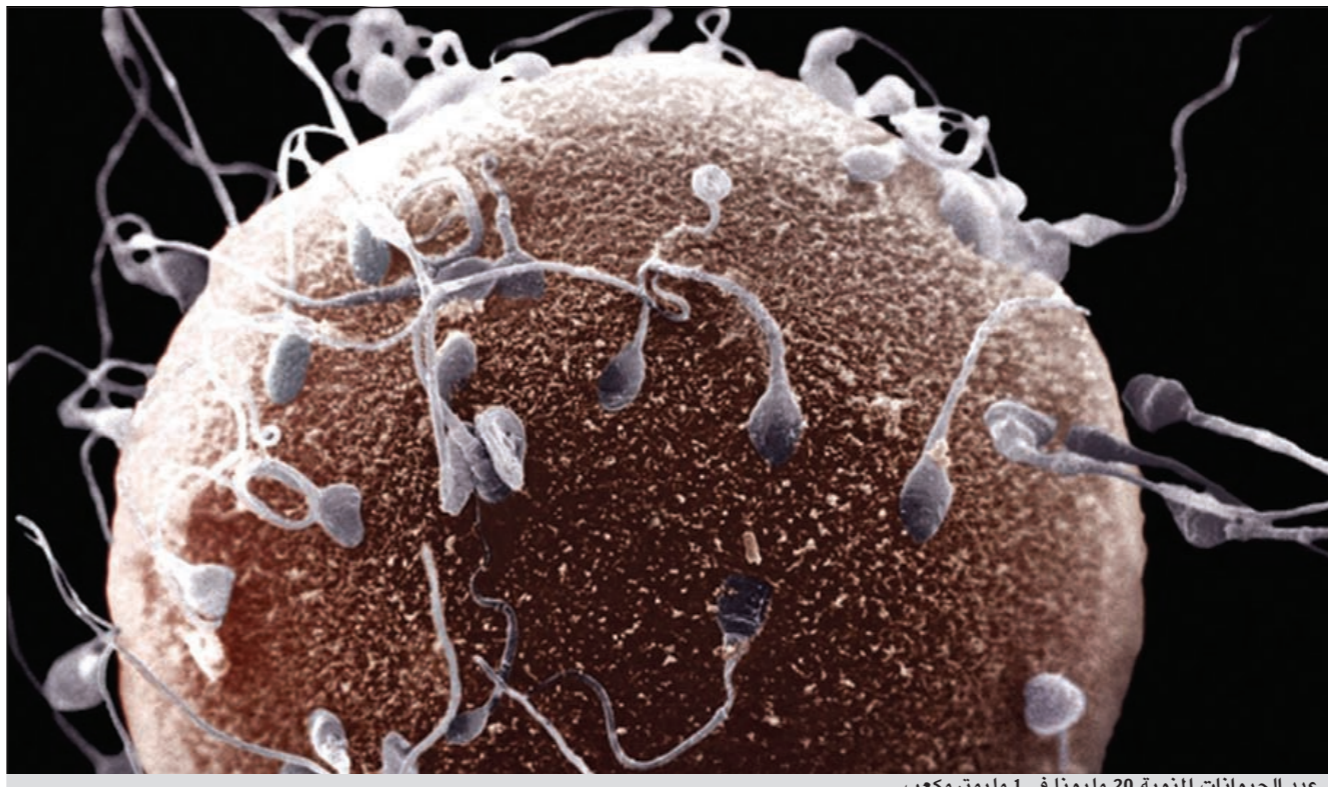
عدد الحيوانات المنوية 20 مليوناً في 1 ملليمتر مكعب

● الحيوانات المنوية قليلة لديك والحيوانات الطبيعية عددها 20 مليوناً في 1 ملم مكعب لكن إذا وصل العدد إلى 21 مليوناً نستطيع أن نأخذها ونفسلها، ونحصى الجيد منها، ونحفظه داخل الرحم، وقبل التلقيح الصناعي لا بد من عمل كشف لأنه من الممكن أن تكون هناك أسباب تجعل عدد الحيوانات المنوية قليلة ونحن نستطيع أن نزيل هذه الأسباب ونساعد في رفع عدد الحيوانات المنوية، وثانياً التلقيح الصناعي لا يؤثر على الجنين ولكن هناك احتمالاً وهو أن يكون وزن الجنين أقل، وهناك احتمال بنسبة 30% أن يكون