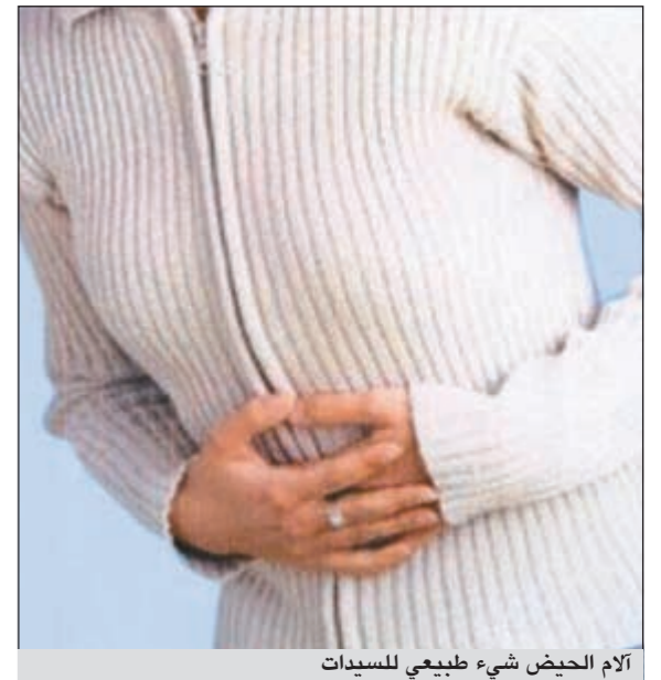
آلام الحوض شيء طبيعي للسيدات