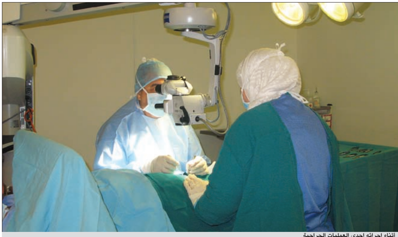
أثناء إجرائه إحدى العمليات الجراحية

فلابد من إجراء عملية حيث نضع حشوة كجهاز تعويض، وتكون مخفية داخل الجسم وتساعد على الانتصاب وتعيد الحياة من جديد.