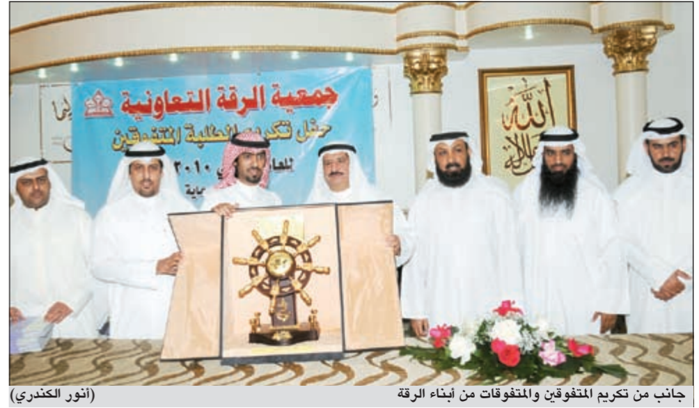
جانب من تكريم المتفوقين والمتفوقات من أبناء الرقة (أنور الكندري)

وأشار كليرموند إلى أن شعرا سيمنس هو «ال أداء العالي مع الأخلاق السامية» ولهذا تتعاظم مع مفهوم الشفافية باتباع إستراتيجية واضحة وقائمة على سياسة عدم التسامح مطلقا مع أي سلوك غير صحيح، كما تعتبر سيمنس واحدة من أولى الشركات التي أنشأت برنامجا خاصا بها يعني بسنن القوائم والامتنال لها ويحتوي «على المبادئ التوجيهية للسلوك المهني» وهي مجموعة من القواعد الملزمة عالميا والتي يطبقها كل موظف في شركة سيمنس من أجل تسهيل مهام أعماله اليومية بأسلوب صحيح أخلاقيا وقانونيا.