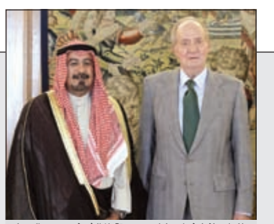
ملك إسبانيا خوان كارلوس سنبغيا الشيخ د. محمد الصباح

المجلس البلدي استعرض المتغيرات المناخية وتأثيرها على البيئة وصحة الإنسان بحضور د. صالح العجيري 12 13