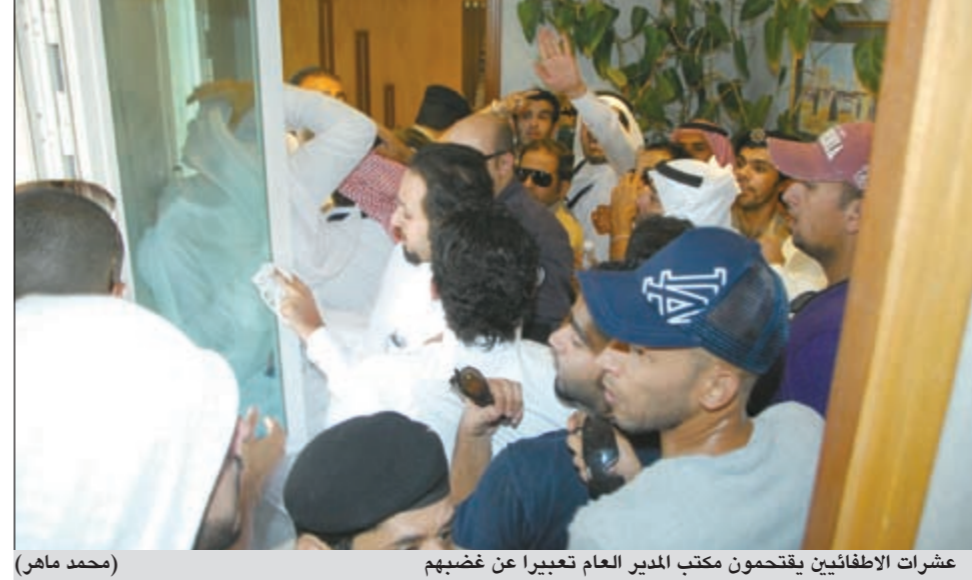
عشرات الإطفايين يقتحمون مكتب المدير العام تعبيراً عن غضبهم (محمد ماهر)

أعلنت شركة نقل وتجارة المواشي أنه صدر قرار من مجلس الوزراء بالموافقة على قيام الشركة بشراء ونقل الأغنام بتكلفتها مضافاً إليها هامش ربح و قدره 15٪.