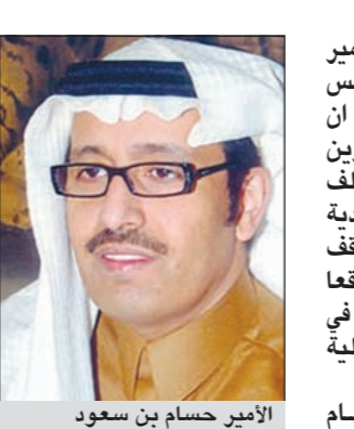
الأمير حسام بن سعود

حصة 25٪ في شركة زين السعودية للاتصالات وذلك لعدم الوصول إلى اتفاق مرض حول الشروط. وقال الأمير حسام امس «نحن متفائلون بان نصف السنة المتبقية من عام 2011 سيكون أفضل من النصف الأول لكونه يشتمل على موسمي رمضان والحج وهما موسمان بارقان إيرادات لشركات الاتصالات كما هو معلوم وبالتالي نتوقع تحقيق المزيد من الإيرادات وارتفاع الربح الإجمالي وتخفيض صافي الخسارة مقارنة مع النصف الأول». وعن توقعاته لأداء الشركة في 2012، قال الأمير حسام «نتوقع تحقيق معدلات نمو كبيرة والتحول إلى مرحلة الربح الصافي حال الانتهاء من مرحلة إعادة هيكلة الأعمال والتي نتوقع أن تتسارع وتيرتها بعد فشل صفقة بيع حصة زين الكويتية لتحالف المملكة بتلكو». وقال «لولا فلتنا بمستقبل زين السعودية بشل عام لما كنا نخطو خطواتنا لإعادة هيكلة رأس المال من خلال خفضه ثم رفعه». وقال الأمير حسام ان أبرز أسباب فشل الصفقة يرجع إلى عدم توفيق التحالف لاتفاق بشأن كفاءة ديون قيمتها 5,5 مليارات دولار تستحق في 2013. وقال «المعضلة الرئيسية في إتمام هذه الصفقة تتمثل في تحويل كفاءة الديون التي تبلغ 5,5 مليارات دولار وتستحق في 2013 للبنوك الدائنة من زين الكويت إلى تحالف المملكة بتلكو». وأضاف «حسب علمنا المشاريع الضخمة في الكويت، كما سيتم التباحث في أهم القضايا المتعلقة بنجاح تنفيذ الخطة الوطنية. وتتضمن قائمة المتحدثين أثناء المؤتمر كلا من فاروق النعسي، الرئيس التنفيذي لمؤسسة المترو الكويتية، وشيخة البحر، الرئيس التنفيذي لبنك الكويت الوطني، د.هاشم الطبطبائي، مدير الفريق التقني لشركة