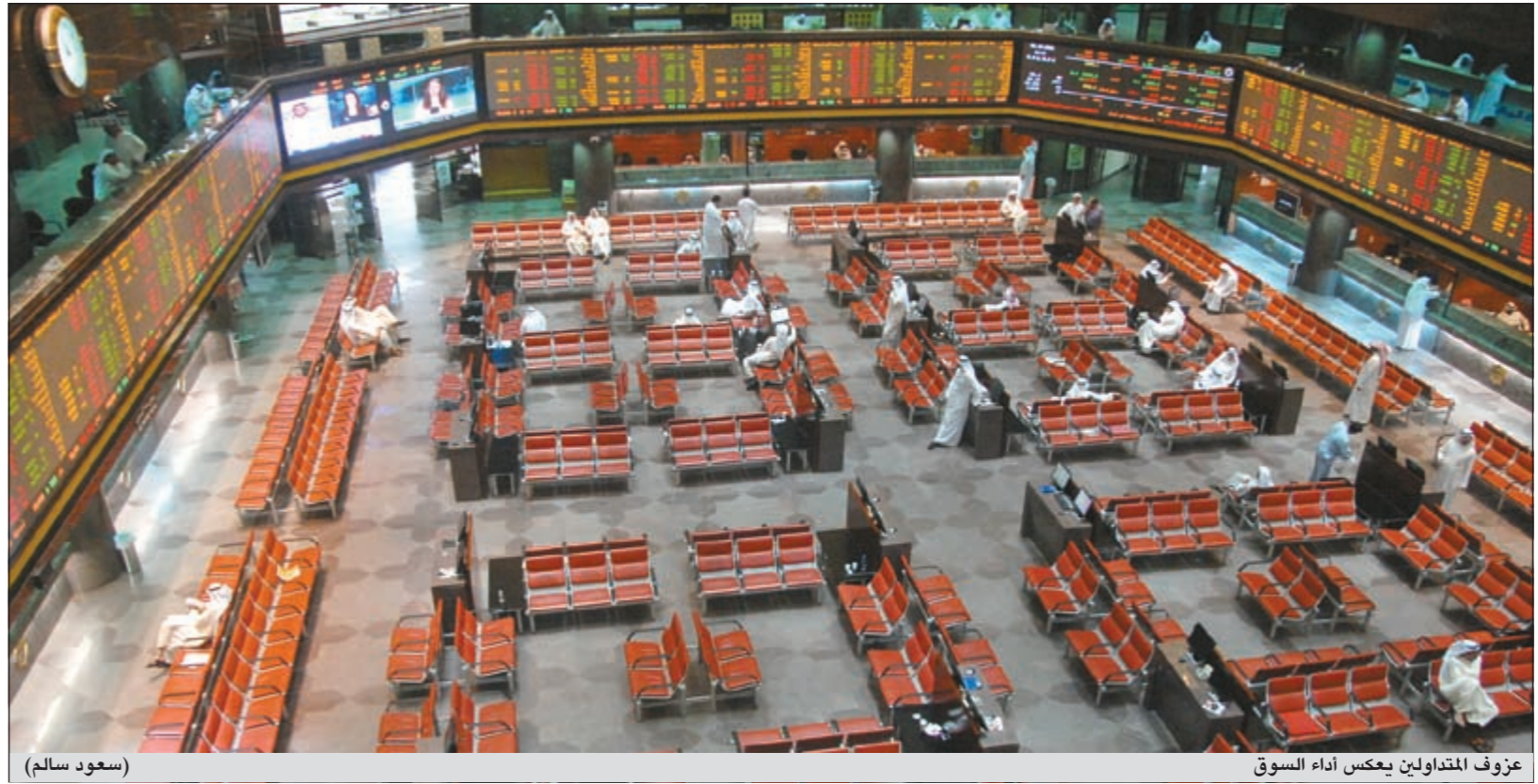
عزوف المتداولين يعكس أداء السوق

اتسمت حركة التداول بسوق الكويت للاوراق المالية بالتذبذب الواضح فسي الأداء مع جنوح للارتفاع في اغلب فترات التداول، واستمر ضعف أداء السوق في أولى جلسات الأسبوع الأول في الربع الأخير من العام الحالي بضغط من اسهم القطاع المصرفي. وشهدت لحظات الاقبال في الثواني الأخيرة من عمر الجلسة ارتفاعاً محدوداً بعد ان كان اللون الاحمر مسيطراً على مؤشري السوق جراء عمليات بيع لجنبي الارباح، وكان التركيز منصبا حصول الاسهم المرخصة مثل الميادين وأبيار وصفاة للطاقة في ظل أداء غير مقنع للاسهم القيادية في أكثر من قطاع، مما انعكس بشكل واضح على مستوى القيمة الاجمالية التي تراجعته بنسبة 25,5٪ مقارنة بجلسة نهاية الاسبوع الماضي. وافتتحت عمليات البيع السريعة لعدد من الاسهم التي ارتفعت خلال الجلسة بظلالها السلبية على مؤشري السوق خاصة الوزني الذي تأثر جراء تقليص مكاسب سهم زين من 30 الى 10 فلوس بعد تداول متوسط في الوقت الذي تراجع فيه اغلب اسهم الشركات المرتبطة بسهم «زين» بفعل عمليات البيع القوية خاصة على سهم «الساحل». ومن المتوقع ان يشهد الربع الاخير استراتيجيات جديدة تعتمد على محاولات تحسين المستويات السعرية للاسهم، مما يندرج بزيادة وتيرة الاداء المصارفي خلال الاسبوع المقبلة خاصة في ظل استمرار سيطرة العوامل السلبية وغياب المحفزات على مجريات حركة التداول بالسوق. المؤشرات العامة ارتفع المؤشر العام للبورصة بواقع 6,1 نقطة ليخلف عن مستوى 5839,2 نقطة بارتفاع